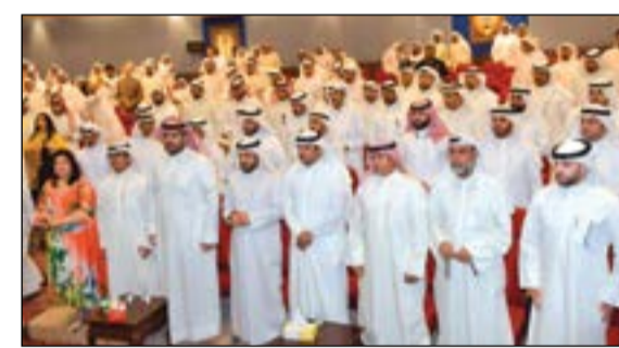
جانين من وقفة المحامين الاحتجاجية أمس في مقر الجمعية (قاسم باشا)

«المحاميين» تستنكر احتجاز الخنة وتطالب بـ«مخاضة القضاء»