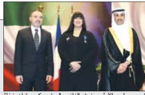
رئيس مجلس الأمة مرزوق الغانم والسفير كريستيان نخلة وعائشة الفارس (عادل سلامة)