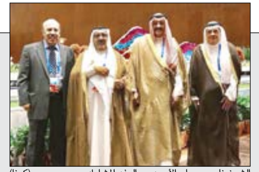
الشيخ ناصر صباح الأحمد مع الوفد المشارك

القيادة السياسية هنأت عائشة الفارس بمناسبة تقليدها وسام الاستحقاق الوطني برتبة فارس من فرنسا 20