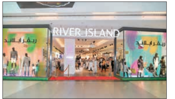
ريفر ايلاند أرقى التصميم (قاسم باشا)

بأنماط زهرية جريئة. أما القطع الخاصة الملقطة للنظر فتشتمل على: ثوب ذهبي براق ضيق طويل، وقميص بمقاس كبير على نمط الكيمونو مزين بشكل فريد من الأكمام، وسترات قصيرة مطرزة بشكل مكثف. FLEUR مجموعة أنيقة تتضمن أشكالاً من الزهور وأنماط مطرزة تزين خطوط الجسم النسائية الفريد. تستقي المجموعة تصميماتها من درجات الوردية وتباينها مع قطع الزينة بالأبيض