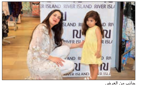
جانب من العرض