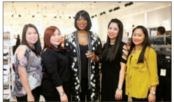
من فريق العمل