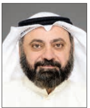
د. وليد الطبيباني

وجه النائب د. وليد الطبيباني سؤالا برلمانيا لوزير التربية وزير التعليم العالي د. محمد الفارس حول الشكاوى المقدمة من بعض المتقدمين للبعثات بسبب إلغاء الابتعاث إلى كليات شرعية واستبدالها بكليات تربوية. ونص السؤال على ما يلي: نشرت بعض مواقع إخبارية شكوى لعدد من المتقدمين للبعثات في كلية الشريعة في جامعة الكويت يدون استياءهم من إلغاء الابتعاث إلى كليات شرعية واستبدالها بكليات تربوية. وعليه، يرجى إفادتي وتزويدي بما يلي: 1- صورة من محاضر اجتماعات لجان البعثات في الأقسام العلمية التي اعتمدت فيها أسماء الجامعات والكليات المرشحة للابتعاث في العام الدراسي الحالي 2017/2016. 2 - صورة من محضر اجتماع لجنة البعثات في كلية الشريعة في جامعة الكويت التي اعتمدت فيها