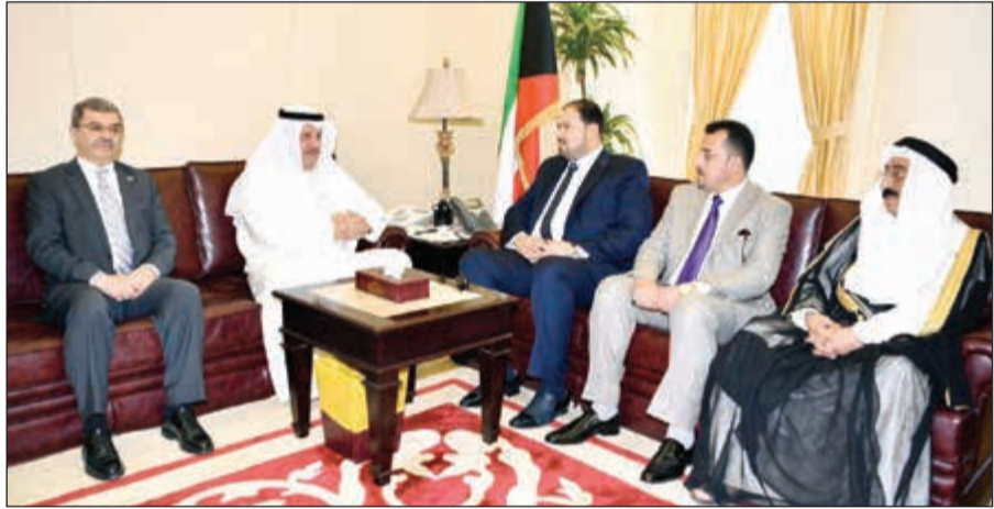
نائب رئيس مجلس الأمة عيسى الكندري مستقبلاً رئيس اللجنة المالية والاستثمار في مجلس النواب العراقي

وتطوير علاقات التعاون بين البلدين في شتى المجالات لاسيما تلك المتعلقة بالجانب البرلماني. كما تطرق الجانبان إلى عدد من القضايا الاقتصادية ذات الاهتمام المشترك إضافة إلى التحديات التي تواجه المنطقة بهذا الجانب والسبل الكفيلة بمواجهتها.