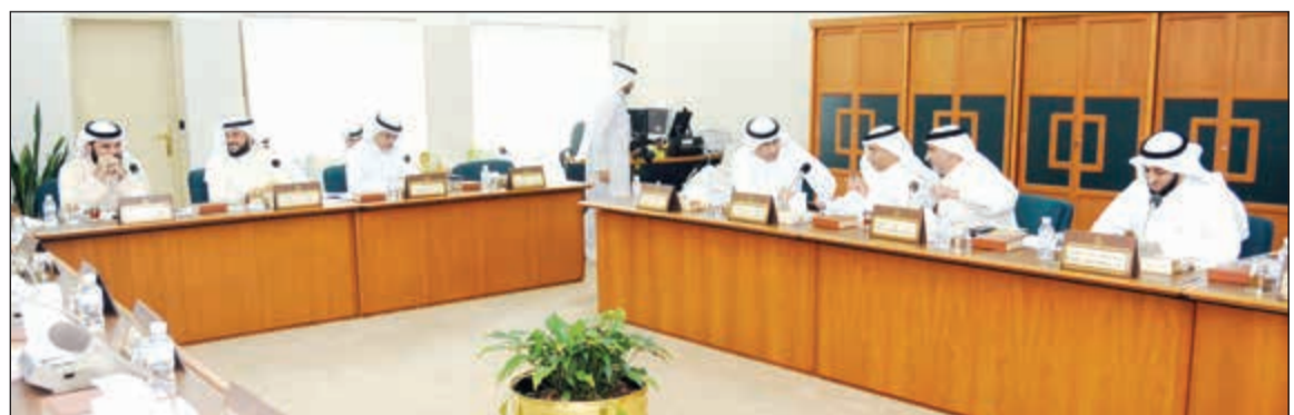
د. خليل عبدالله ود. محمد الحويلة ود. جعان الحرش ووزير التربية د. محمد الفارس خلال اجتماع اللجنة التعليمية أمس

النظر في الشرائح الأخرى المساندة للمعلم. وذكر الحويلة من هؤلاء الأشخاص الاجتماعيين والفنسيين ومصممي التقنيات التربوية وموجهي التقنيات التربوية وأمناء المكتبات المدرسية وموجهي المكتبات في المناطق