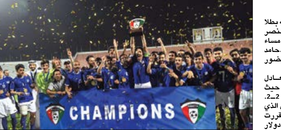
فرحة لاعبي التضامن باللقب