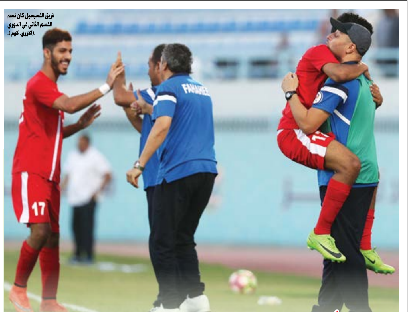
فريق الفيحجيل كان نجم القسم الثاني في الدوري (الأزرق، كوم).

تأهل فريقا «مساعدة الصالح» و«سوكر» إلى المباراة النهائية لبطولة ملتقى المصريين لكرة القدم، والتي تقام على ملعب بيان برعاية شرفية من السفارة هويدا عصام وبالتعاون مع الهيئة العامة للرياضة وقناة برزنتيشن كيزن. وأسقط فريق مساعدة الصالح نظيره مجلة المراد بهدفين نظيفين، وفاز فريق سوكر على المدير بثلاثة أهداف مقابل هدفين. ويلتقي الفريقان في النهائي لتكون معركة كروية قوية ثارية، حيث سبق أن التقيا في بداية البطولة في المجموعات وفاز الصالح برعاية، ولذلك من المتوقع أن يكون نهائي «كسر عظام» بين الفريقين لحصد اللقب.