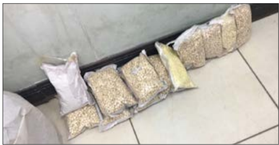
الحبوب المخدرة بعد ضبطها

فوق الإطار الأمامي من الجهة اليمنى، ولم تمر ساعات على الضبطية السابق ذكرها حتى تم الاشتباه في شاحنة أخرى وأخضعت هي أيضاً لعمليات التفتيش وضبط في مخبا سري على نحو 16 ألف حبة نوع كبتاغون أيضاً. هذا، وأشرف على الضابطتين مدير الجمرک البري بالكثيف السيد مشعان السعيد وتم اخطار وزارة الداخلية لتسلم المضبوطات والمتهمين واستكمال الإجراءات القانونية.