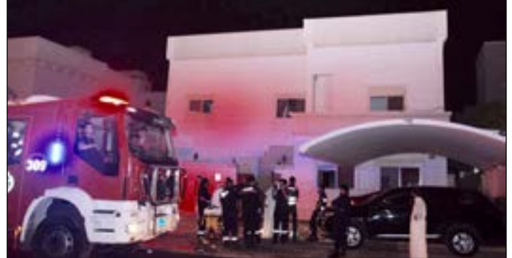
رجال الإطفاء همروا الى موقع الحريق

إطفاء مركزي الجهراء الحرفي والجهراء الى موقع البلاغ، وعند وصول رجال الإطفاء للموقع تبين ان الحريق يقع في غرفة في الدور الأرضي وان هناك أشخاصاً محتجزين في الدور الأول. ما حدا برجال