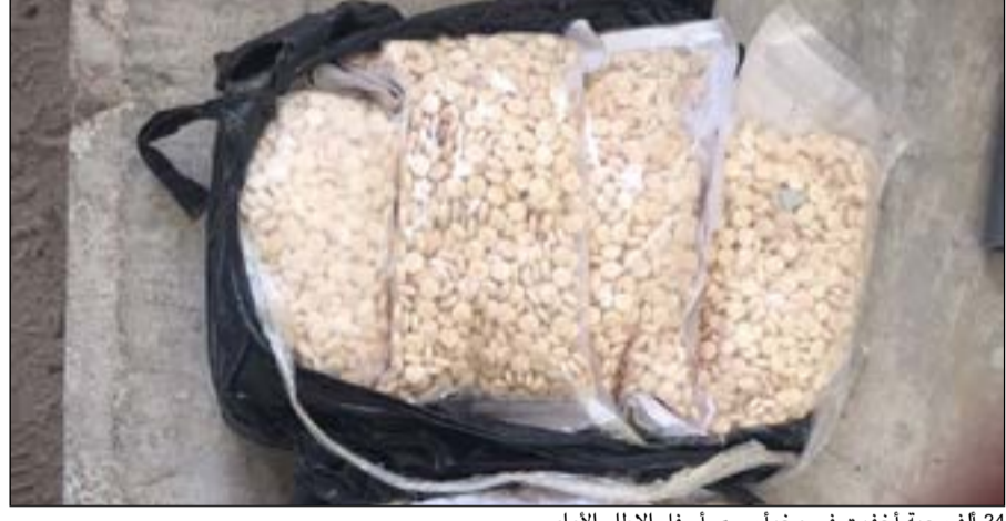
24 ألف حبة أخفيت في مخبا سري أسفل الإطار الأمامي

أحبط رجال جمارك العبدلي امس محاولتين لتهريب كمية من الحبوب المخدرة نوع كبتاغون بواقع 24 ألف حبة و16 ألف حبة في ضبطية أخرى. وكان رجال جمارك العبدلي اشتبهوا في شاحنة قادمة من العراق ليتم اتخاذ الإجراءات اللازمة وإخضاعها للتفتيش وأسفرت عملية التفتيش عن ضبط 24 ألف حبة وقد أخفيت بطريقة سرية