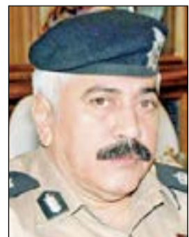
الفريق محمود الدوسري

نفذت دوريات المرور عدة حملات خلال الأسبوع الماضي أسفرت عن إبعاد 4 وافدين وإحالة 13 حدثاً لنيابة الأحداث للقيادة بدون رخصة سوق، كما تم تحرير نحو 35 ألف مخالفة، وفي التفاصيل: كانت إحصائية المخالفات الأسبوعية للإدارة العامة للمرور قد كشفت عن حجب 52 مركبة ودخول 12 بالانظرارة وتحرير 2628 مخالفة.