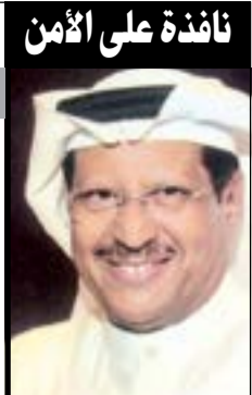
نافذة على الأمن

المتوافرة لدى الإطفاء البحري تجعلها قادرة على التحرك والتعامل مع أي بلاغات في أي ظروف مناخية. ومضى بالقول إذا كانت الظروف الطبيعية جيدة ووقع عطل أو ما شابه فهناك شركة خاصة تتعامل مع هذه الاعطال بمقابل ولكن هذا لا يمنع مطلقاً من التجاوب مع أي بلاغ فيه مساس بأرواح وممتلكات المواطنين والمقيمين. إلى ذلك جدد مصدر رفيع في خفر السواحل التأكيد على أن دور خفر السواحل والسي جانب أن تتعاملها مع كافة البلاغات المرتبطة بسلامة المواطنين والمقيمين فهي معنية بالتصدي لحالات المساس بأمن الوطن والتصدي لكافة المهربين لما تملكه من منظومة إدارية على مستوى متقدم. وأردف المصدر بالقول إن ما جاء في التواصل الاجتماعي من حديث مغلوط في المعلومات، حيث إن المواطن كان في عرض البحر عندما