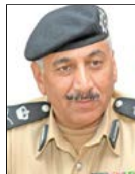
اللواء فهد الشويبي

وفي العاصمة تم تحرير 8914 مخالفة وحجز 47 مركبة ودخول 9 أشخاص النظارة بينهم حدث وفي حوالي تم تحرير 7309 وحجز 82 مركبة وحجز 12 بالنظرارة و11 حدثاً وضبط 7 مطلوبين، فيما تقرر إبعاد 3 وافدين، وفي الفروانية تم تحرير 5375 مخالفة وحجز 64 مركبة ودخول 3 النظارة، وفي الاحمدي تم تحرير 4377 مخالفة حجب 44 مركبة ودخول 2 النظارة،