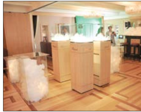
شوبارد... رمز الجمال والدقة