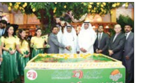
مشاركة بقطع كيكة الحفل