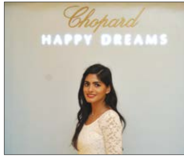
Happy Dreams لصاحبات الذوق الرفيع