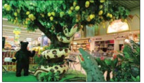
شجرة المانجو في لولو