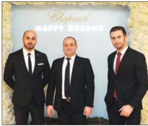
من فريق العمل