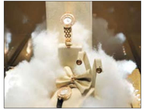
من مجوهرات شوبارد