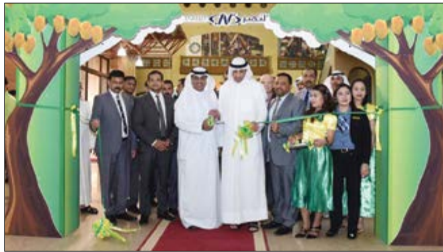
افتتاح مهرجان المانجو في لولو

والغريبة وبأسعار معقولة. وقد وصفت لولو هايبرماركت نفسها باستمرار بأنها الشركة التي تلبى توقعات العملاء للمنتجات ذات الجودة العالية وبأسعار تنافسية. يقدم الهايبر ماركت تجربة تسوق فريدة من نوعها من خلال حملات جذابة موجهة للعملاء والتي تساعد على جذب اهتمام المتسوقين وزيادة الدعم للعلامة التجارية.