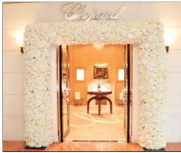
مجوهرات شوبارد تزينت بالورود (عادل سلامة)