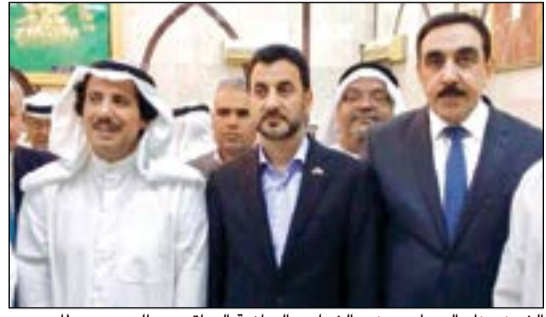
الشيخ عزام الصباح ووزير الشباب والرياضة العراقي عبدالحسين عبطان

ونكرت السفارة الكويتية في بيان صحفي أن الوزير عبطان أتى خلال لقائه عميد السلك الدبلوماسي سفير الكويت لدى مملكة البحرين الشيخ عزام الصباح على مساندة الكويت وشعبها للعراق على مدى التاريخ في سبيل استقراره وازدهاره، معرباً عن تمنياته في أن تستثمر الكويت الفرص الاستثمارية