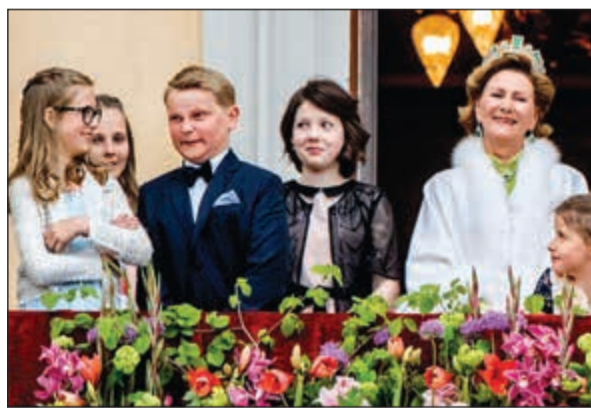
الامير يداعب شقيقته

النرويج - إيلاف: أدى أمير نرويجي صغير رقصة داب الشعبية في النرويج، بينما كان يقف في عداد العائلة الملكية في أثناء الاحتفال بالذكرى الـ 80 لميلاد الملك والملكة. فقد تجمع نبلاء النرويج على شرفة قصر أوسلو الملكي للاحتفال بالذكرى الثمانين لميلاد الملك هارالد والملكة سونيا، وشاهدتهم الملايين في جميع أنحاء العالم. لكن الاحتفال هذا لم يفض على «خيرو»، إذ تسلل الملل إلى نفس الأمير سفير ماغنوس المشاغب، الماضية.