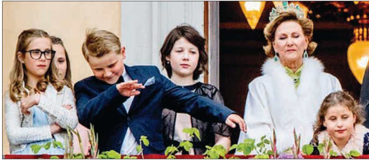
ماغنوس يرقص على المنصة