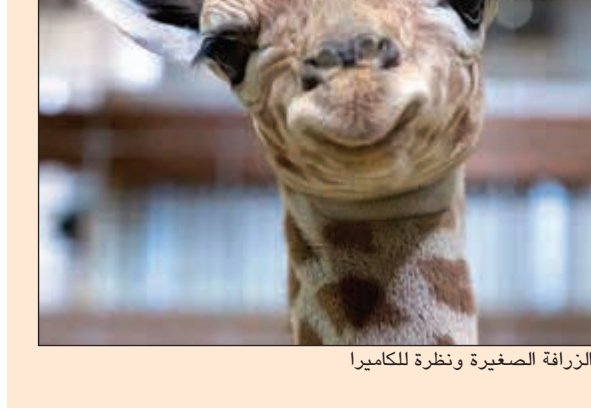
الزرافة إلى جوار أمها بالمزرعة

نشرت «بي بي سي نت» مجموعة من أفضل الصور حول العالم خلال الأسبوع الماضي من 6 إلى 12 مايو الجاري. وجاء من ضمن الصور، صورة جميلة لزرافة عمرها يوم واحد، وبدت الزرافة الصغيرة تقف إلى جانب أمها بحديقة حيوان سفينة نوح في بريستول بإنجلترا، في وادعة وجمال.