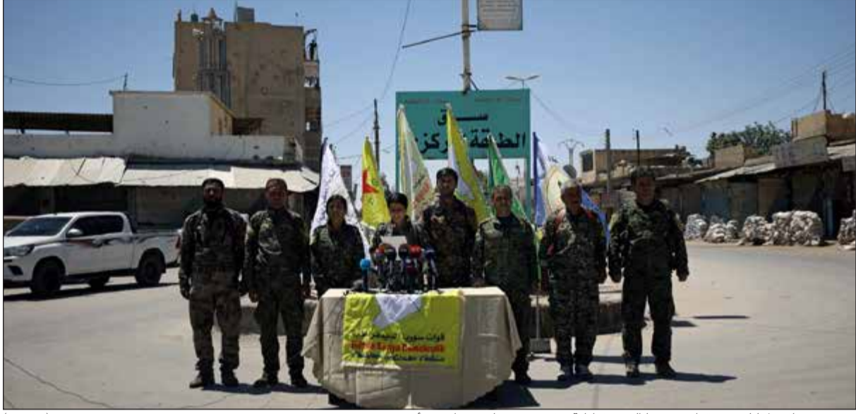
مؤتمر صحافي لمقاتلين من قوات سوريا الديمقراطية عقب تحريرها من «داعش» أمس (رويترز)

عواصم - وكالات: استكمالا لعملية إجلائهم بعد توقف دام ثلاثة أيام نتيجة عقبات واجهت الاتفاق، خرج مئات الأشخاص، بينهم مقاتلون معارضون، أمس من حي برزة الواقع في شمال دمشق.