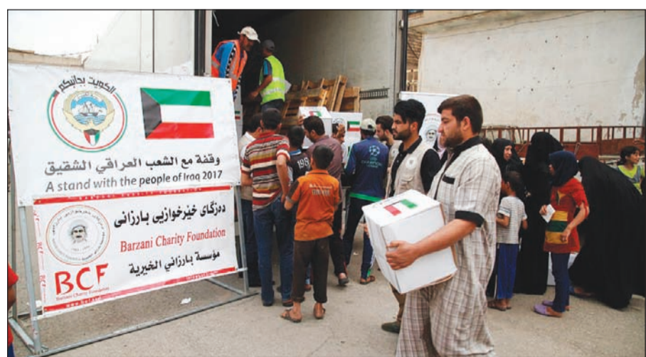
جانب من توزيع المساعدات الكويتية في الموصل