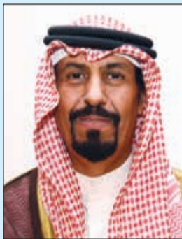
الشيخ علي الخالد

روما - كونا: وصف سفيرنا لدى إيطاليا الشيخ علي الخالد الانفجار الذي وقع بالعاصمة الإيطالية روما صباح الجمعة بأنه «عمل محدود لا يمس وضع الأمن والحياة الطبيعية» بالمدينة.