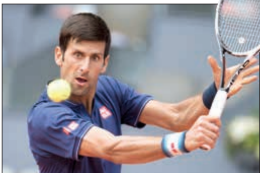
بمساعدة في ثلاث ادوار تنس مدريد

أفست الصربي نوناف ديوكوفيتش، المصنف ثانيا وحاصل اللقب، من الخروج المبكر من دورة مدريد الإسبانية الدولية لكرة التنس رابع دورات الماسترز لآلاف نقطة وحجز بطاقة إلى الدور الثالث بفوز صعب على الإسباني نيكولاس ماجروو 1-6 و4-6 و7-5. وعانى نادال الرابع الأمين لتخطي عقبة الإيطالي فاييو فونيني واحتاج إلى 3 مجموعات 6-7 (3-7) و6-6 و6-4.