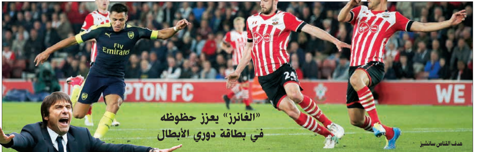
هدف الفانس سانشير

وبلغ الكندي ميلوس راونيتش الخامس الدور الثالث بفوزه على اللوكسمبورغي جبل مولر 4-6 و6-4.