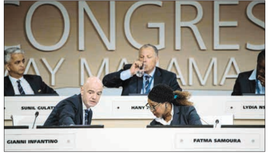
انفانتينو وسامورا وخلفهما المصري هاني ابوريعة

انفانتينو يدافع أمام الجمعية العمومية عن أسلوب قيادته لفيفا