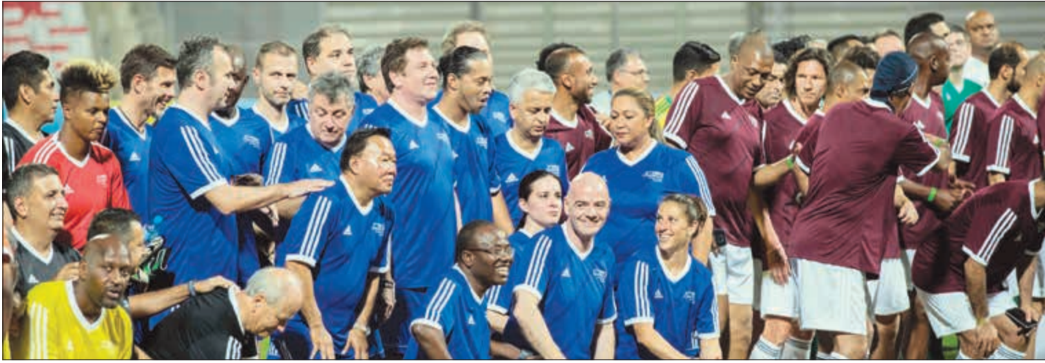
فريق الفيفا مع فريق الأساطير معا على أرض البحرين