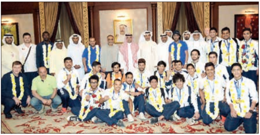
فليطح متوسطا أبطال المباراة

في البطولات الآسيوية والوقوف على منصات التتويج مؤكدا انه يوجد لاعبين مميزون بالأسلحة الثلاثة قادرين على الوصول إلى أبعاد المستويات الفنية بشرط الانتظام في التدريبات والمعسكرات الخارجية.