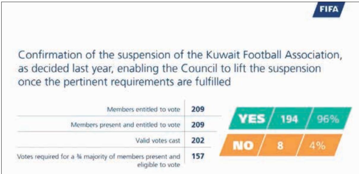
صورة لنتيجة التصويت على ملف الكويت

فشل لجنة المعايير المعينة من قبل فيفا في الاتحاد الغواتيمالي لكرة القدم. دفاع مستميت دافع رئيس الاتحاد الدولي لكرة القدم (فيفا) جاني انفانتينو في افتتاح كونغرس الاتحاد في المنامة، عن ادائه على رأس الهيئة الكروية التي عصفت بها فضائح الفساد، ورفضاً أي حديث عن ديكتاتوريته وسعيه الى تثبيت نفوذه. وقال ان الفيفا «الجديد (هو) ديموقراطي وليس ديكتاتوريا»، مؤكداً «نحن نعيد تكوين الفيفا بعد كل الذي أصابه»، في إشارة الى فضائح الفساد التي بدأت بالظهور منذ عام 2015. وتابع «فيفا تغير، ونحن اناس جدد سندع لأفعالنا ان نتكلم عننا وليس اقوالنا»،