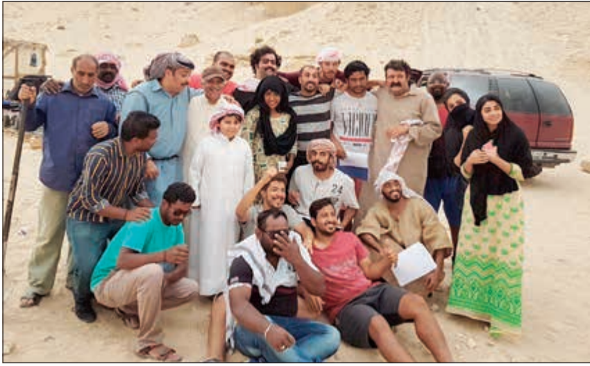
.. ومع فريق مسلسل «سيل وهيل»