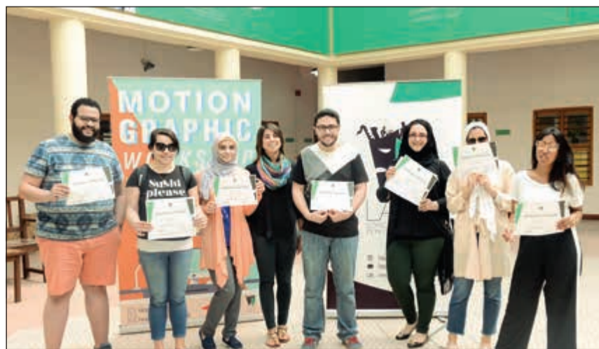
.. وتتوسط المشاركين في الورشة

الحركة، والصوت. وقالت: هذا الفن وسيلة تفاعلية جدا ذات قدرة عالية على جذب الجمهور سواء في أعمال فنية أو الدعاية للعلامات التجارية لهذا يجب أن نعطيه اهتماما كبيرا ونشجع الشباب على ممارسته لإيجاد وخلق فرص وظيفية عصرية في مجالات التسويق والإعلان وغيرها.