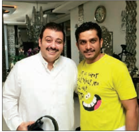
المخرج خالد الفضلي مع النجم حسن البلام