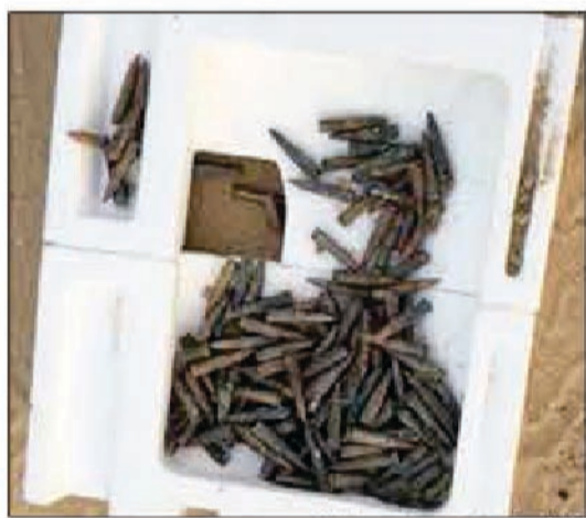
الطلقات المبعث في مباحث السلاح