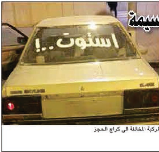
المركبة المخالفة إلى كراج المحجز

ارتداء حزام الأمان. هذا، وعن أمر مدير عام مديرية أمن الإحمدى العميد عبدالله سفاوح تمت إحالة المركبة إلى كراج المحجز. وبحسب مصدر أمني فإن بلاغاً ورد إلى عمليات الداخلية من مواطن قال في البلاغ إن هناك مركبة رياضية قديمة مدون عليها «استوت» يسير قائدها بها برعونة وأستهتار وعلى الفور توجهت دورية ورصدت المركبة تسير عكس السير ليمت توقيفها بعد مطاردة.