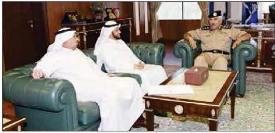
الفريق محمود الدوسري خلال اجتماعه وعمر شرقاوي وفاصل الشمري

كما ناقش المجتمعون طريقة تفعيل آلية تنفيذ الأحكام القضائية الصادرة واتخاذ القرارات بشأن تنفيذ الأحكام والتنسيق والتعاون المشترك بين وزارتي الداخلية والعدل عن طريق الربط الآلي من أجل مرونة تنفيذ الأحكام القضائية. وفي نهاية الاجتماع أعرب الفريق الدوسري عن شكره وتقديره للجهود المبذولة في هذا المجال، متمنياً أن تستمر هذه الجهود من أجل حفظ الأمن في ربوع البلاد.