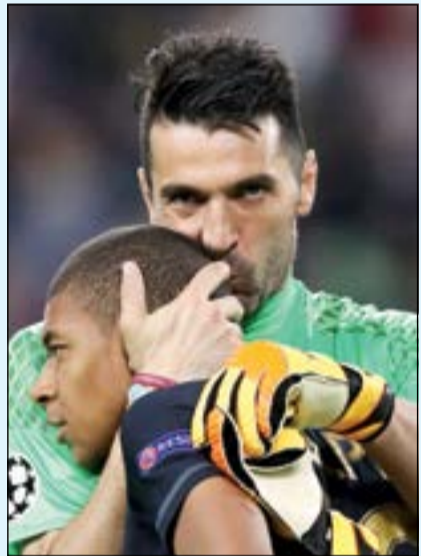
العلاق بياسي الصغير

شباك حارس يوفنتوس بوفون ظلت نظيفة لمدة 690 دقيقة بدوري الأبطال حتى سجل كيليان مبابي هدفة، علماً أنه الهدف الوحيد الذي سكن شبك السيدة العجوز في الأدوار الإقصائية بالمسابقة خلال الموسم الحالي والثالث منذ بداية البطولة.