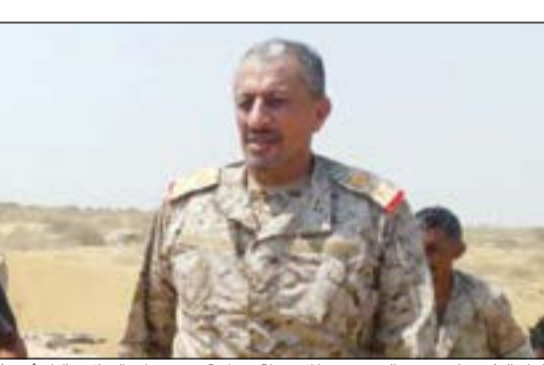
اللواء الركن علي حميد القشبي خلال جولة ميدانية في جبهات القتال

عسكرية مدروسة والقرار بالبدء في عملية تحرير الحديدة والساحل الغربي قد صدر من القيادة العسكرية وسشهد الأيام القادمة أخباراً سارة بهذا الشأن، لافتاً إلى أن ميناء الحديدة يمثل أهمية إستراتيجية كبيرة للمتحردين لأنه يعد شرياناً رئيسياً يمددهم بالغذاء والسلاح لذلك يستمتون في الدفاع عنه. في غضون ذلك، نجحت القوات السعودية المشتركة أمس في صد هجوميين للميليشيات الحوثية قبالة منطقة نجران. وأفاد مراسل قناة «العربية»، الفضائية، بأن الهجومين جاءا في توقيتين مختلفين، الأول في ساعات الصباح الأولى عندما حاولت الميليشيات الحوثية باعداد كبيرة الاستيلاء على 3 أبراج مراقبة سعودية «صحي، والبريمة، والوقبة»، إلا أن مدفعات القوات السعودية