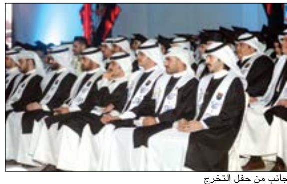
جانب من حفل التخريج