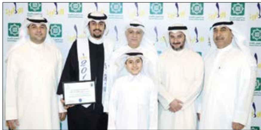
عدد من الخريجين في جناح «بيتك»

أنشطة الكلية وتحمل أعباء المسؤولية الاجتماعية تجاه الشباب والعملية التعليمية بما يعكس رسالة «بيتك» ويجسد مكانته الرائدة محلياً وإقليمياً وعالمياً، ويرسخ دوره السباق وتميزه في المسؤولية الاجتماعية.