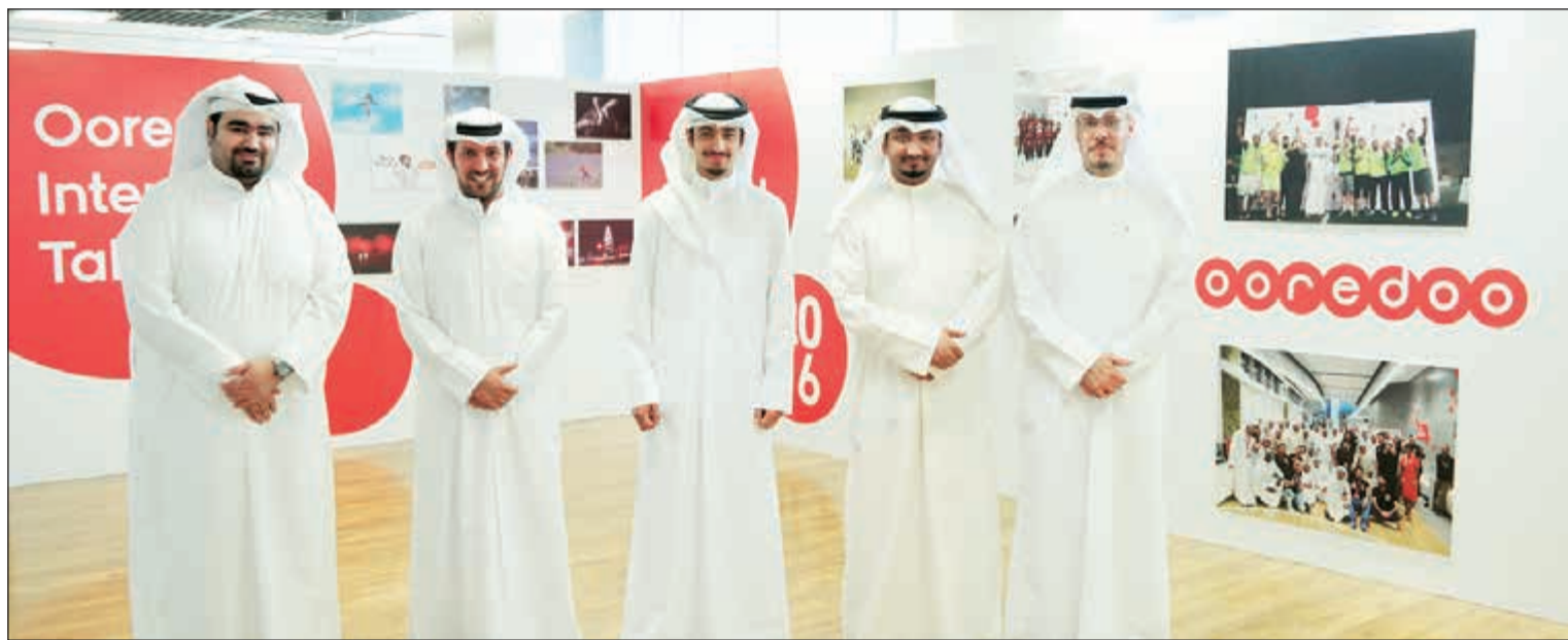
الفارس الحساوي متوسطا فريق الاتصال المؤسسي

الدولة لشؤون الشباب تسعى من خلالها لدعم المبادرات الشبابية التي ترعاها الوزارة، كما شاركت كراع رسمي لحفل تكريم الجهات التطوعية الذي اقامته الوزارة تزامنا مع اليوم العالمي للتطوع.