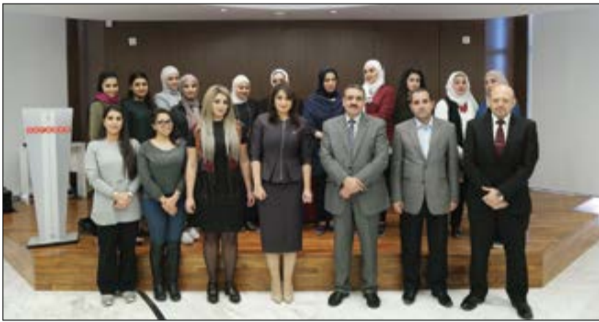
صورة جماعية للطلبة والطالبات