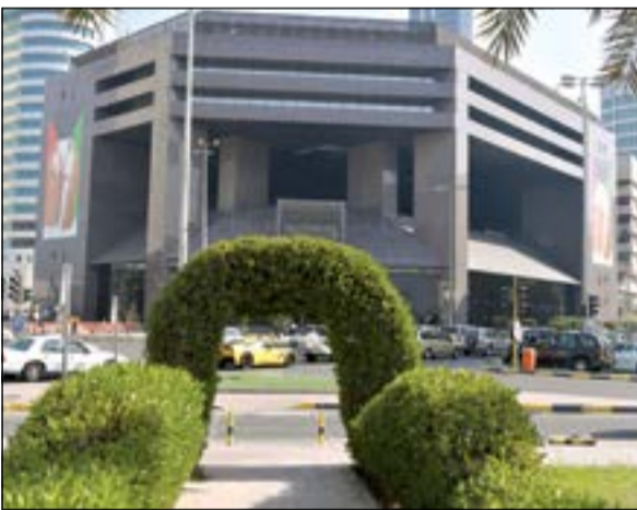
اللون الأخضر يعود للبروصة بعد جلسة دامية بداية الأسبوع (قاسم باشا)

البورصة تستعيد نوازينها.. وتربح 320 مليون دينار 55