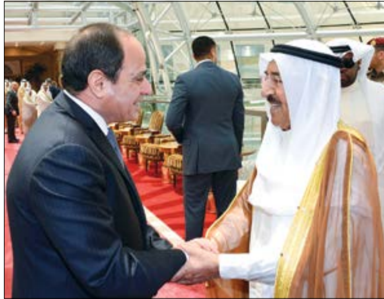
صاحب السمو مضافا الرئيس عبدالفتاح السيسي