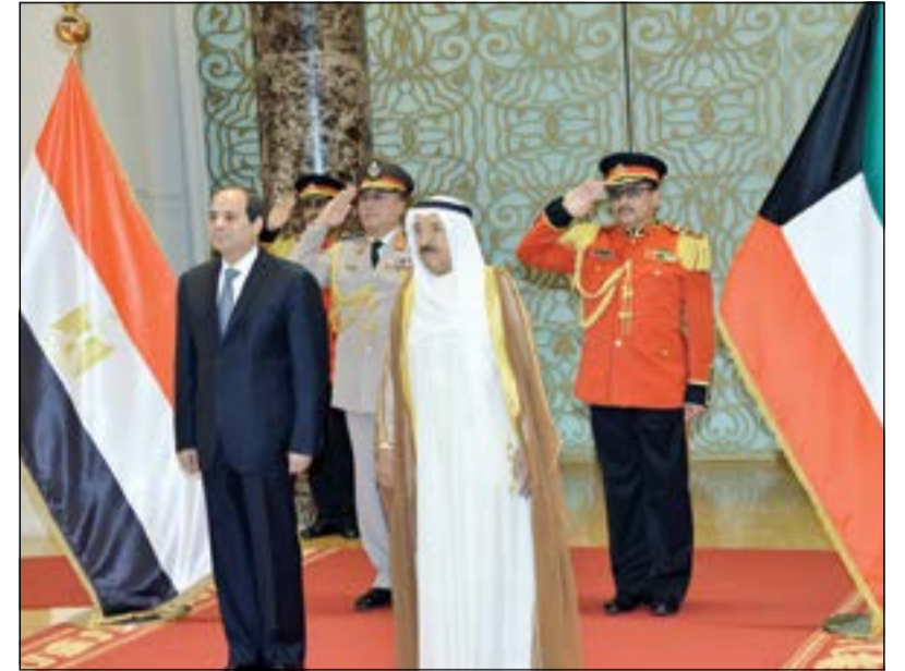
صاحب السمو الامير الشيخ صباح الاحمد مودعا الرئيس المصري عبدالفتاح السيسي

صاحب السمو كان على رأس مودعيه في المطار بعد زيارته الرسمية للبلاد