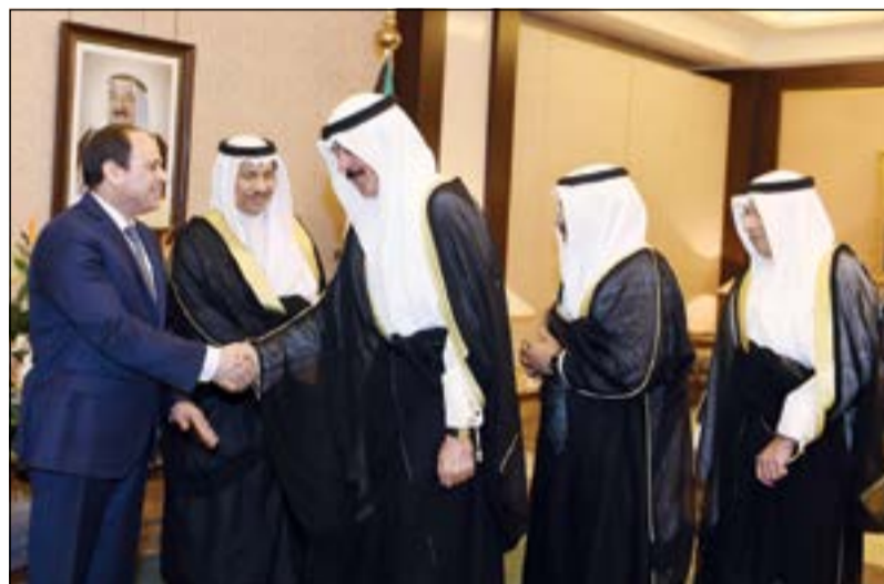
الرئيس المصري مضافا الشيخ محمد الخالد ويبدو الشيخ دسالم الجابر والشيخ خالد الجراح