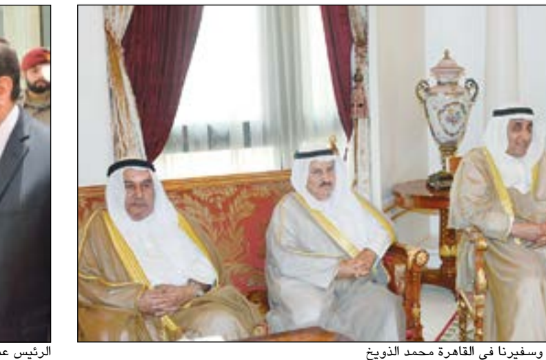
الرئيس المصري خلال استقباله عبدالوهاب البدر بحضور محمد شرار وسفيرنا في القاهرة محمد الذويخ