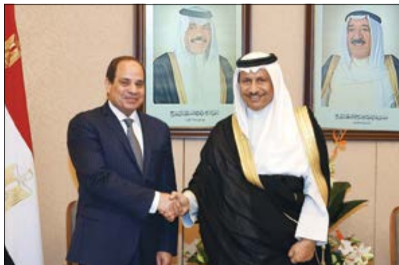
سمو رئيس الوزراء الشيخ جابر المبارك خلال استقباله الرئيس المصري عبدالفتاح السيسي