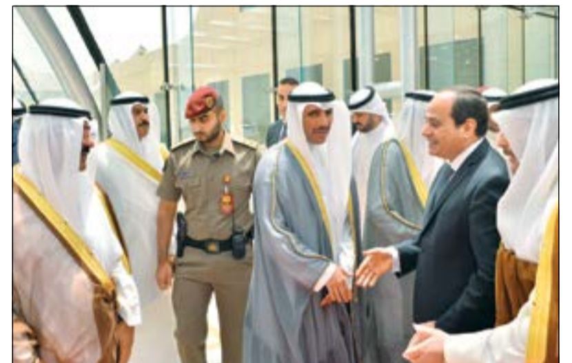
رئيس مجلس الأمة مرزوق الغانم والشيخ مشعل الاحمد في وداع الرئيس المصري