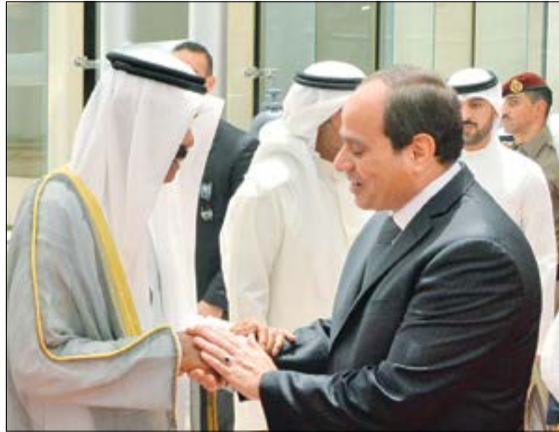
سمو ولي العهد الشيخ نواف الاحمد مضافا الرئيس المصري

رحب رئيس حملة الرئيس عبدالفتاح السيسي في الكويت اثناء الانتخابات الرئاسية السابقة وحيد فرج بالزيارة التاريخية للرئيس المصري، مؤكدا عمق العلاقات بين البلدين حيث تربطهما علاقات تاريخية ومصير مشترك. وأكد فرج ان الشعب الكويتي لن ينسى المواقف التاريخية للكويت اميرا وحكومة وشعبا ودعمها اللا محدود لمصر وشعبها الابي خلال الفترة الماضية.