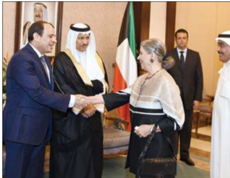
الرئيس عبدالفتاح السيسي مضافا فاطمة حسين بحضور الزميل عدنان الراشد