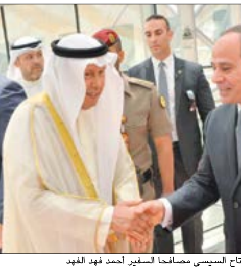
الرئيس عبدالفتاح السيسي مضافا السفير أحمد فهد الفهد