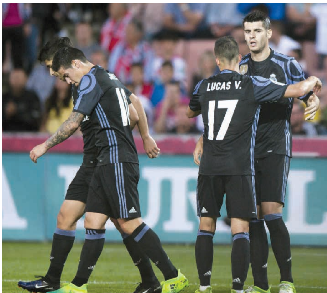
الريال يمن حضر (دويرتز)

ولم تكن حال فيورنتينا افضل وسقط في فخ التعادل امام مضيفه ساسوولو 2-2. فرنسا واصل موناكو زحفه نحو اللقب الأول منذ 17 عاما بفوزه على مضيفه نانسي 3-0 في المرحلة السادسة والثلاثين من الدوري الفرنسي. ورفع موناكو رصيده من الأهداف إلى 98 في الدوري هذا الموسم، متقدما بفارق كبير عن سان جرمان (77 هدفا). وضمن انحيه استمراره بين الكبار موسم آخر بتعاقده 1-1 مع مضيفه لوريان.