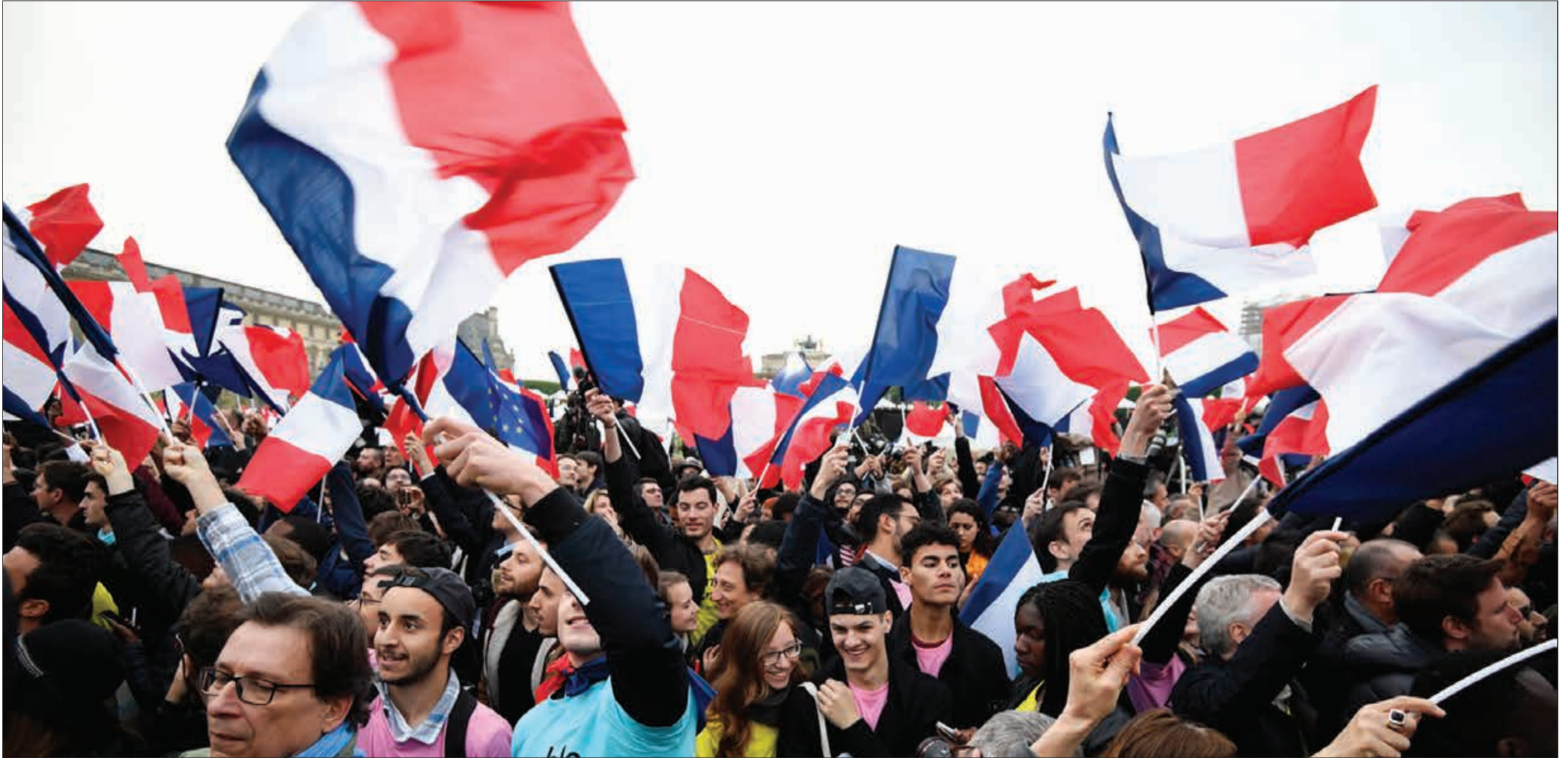
انتصار الرئيس الفرنسي الجديد إيمانويل ماكرون يحتفلون بفوزه على منافسته اليمينية المتطرفة مارين لوبن أمام متحف اللوفر أمس (أ.ب)

المقربين ونحن نرحب بالعمل مع الرئيس الجديد حول مجموعة واسعة من الأولويات المشتركة». من جانبه، أعلن المسجد الكبير في العاصمة الفرنسية باريس أمس أن فوز مرشح الوسط إيمانويل ماكرون على المتطرف وائتخابه رئيسا لفرنسا علامة على المصالحة بين الأديان في البلاد. وقال المسجد الكبير في بيان «إنها علامة واضحة على الأمل للمسلمين الفرنسيين بأن بوسعهم العيش في وفاق واحترام للقيم الفرنسية».