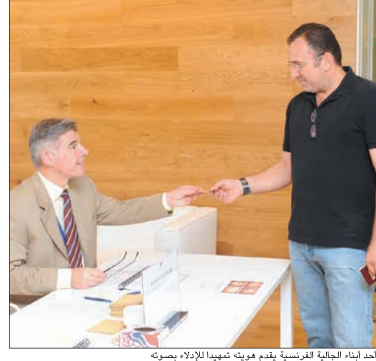
أحد أبناء الجالية الفرنسية يقدم هويته تمهيدا للإدلاء بصوته

أسامة دياب ذهب الفرنسيون في الكويت إلى صناديق الاقتراع للإدلاء بأصواتهم في الجولة الثانية من الانتخابات الرئاسية، لانتخاب رئيسهم الجديد، بعد انتهاء فترة الرئيس فرانسوا هولاند الذي يحكم البلاد منذ عام 2012. وقد أشاد السفير الفرنسي لدى البلاد كريستيان نخلة بالجهود والتسهيلات التي قدمتها السلطات الكويتية لتسهيل عملية الاقتراع لمواطنيه، سواء من حيث تعزيز الأمن وتأمين مشاركتهم، لافتا إلى التنسيق الواضح بين السلطات الكويتية والسفارة. ولغت نخلة إلى أن تعداد الجالية الفرنسية المسجلة لدى السفارة في الكويت يقدر بـ 1142 يحق لـ 707 منهم التصويت في هذه الانتخابات، لافتا إلى حرص أبناء الجالية على المشاركة في هذا الاستحقاق الوطني.