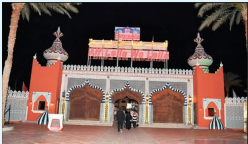
مدخل ألف ليلة وليلة

كما نريد الدخول في إقامة مشروعات مثل تشييد قاعة مؤتمرات ضخمة، ومدينة ترفيهية وكل هذه الاستثمارات جاهزة مع توافر خريطة متكاملة