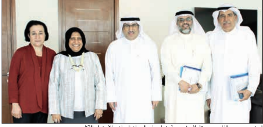
الوزير د.محمد الفارس مستقبلاً رئيس وأعضاء وفد الجهاز الوطني للاعتماد الأكاديمي

وقام أعضاء الوفد بتسليم التقرير النهائي حول الزيارة إلى الوزير الفارس.