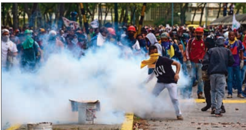
طلاب يتفادون الغاز المسيل للدموع خلال مظاهرات معارضة للرئيس مادورو امس الاول

الرئاسية في مواجهة نيكولاس مادورو في 2013 أن الجيش بدأ يتراجع عن تضامنه مع السلطة، منوها إلى أن 85 جنديا سجنوا لأنهم عبروا عن معارضتهم للقمع. وفي هذه الأثناء، تنفشي الشائعات المتصلة بالأزمة الفنزويلية على شبكات التواصل الاجتماعي، كذلك التي تقول ان الرئيس «مادورو ذهب إلى المنفى»، وأخرى أن أحد أبرز قادة المعارضة «ليوبولدو لوبيز قد مات»، فتزيد من حالة توتر في أوجها أصلا. محلي شهير، ان ليوبولدو لوبيز، أحد أبرز قادة المعارضة، المسجون في الوقت الراهن، قد نقل من سجنه الى مستشفى «في حالة بالغة الخطورة»، وتقول عائلته انها لم تتلق أخبارا عنه منذ أكثر من شهر.