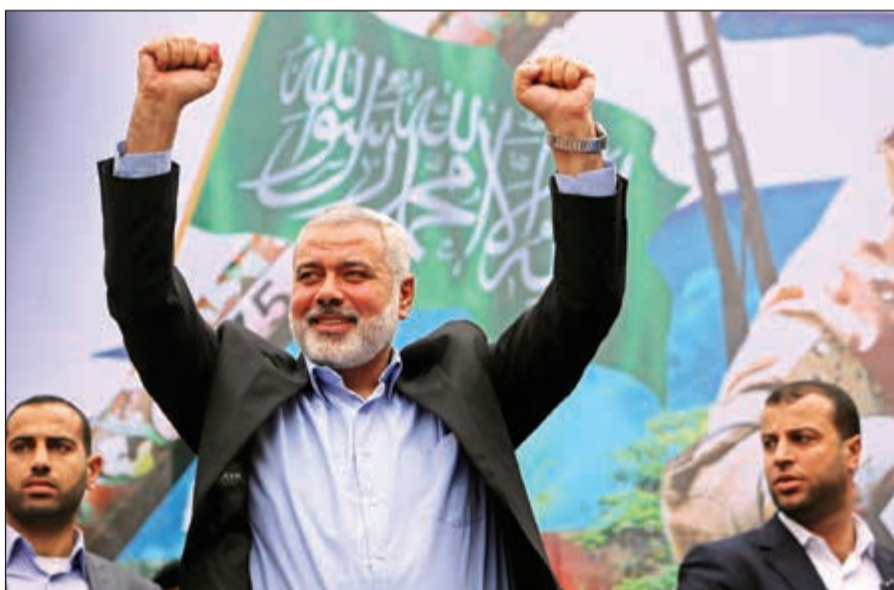
صورة ارشيفية لهنية خلال فعالية بقطاع غزة

وتعرض هنية لمحاولة اغتيال إسرائيلية، بينما كان برفقة الشيخ ياسين في 6 سبتمبر عام 2003. وخلال الانتخابات التشريعية التي جرت عام 2006، ترأس هنية كتلة التغيير والإصلاح التابعة لحماس، والتي حصلت غالبية المقاعد، ليكلفه الرئيس الفلسطيني محمود عباس، بتشكيل الحكومة. غير أن عباس أصدر قرارا بإقالته من رئاسة الحكومة في 14 يونيو 2007 إثر سيطرة حماس على قطاع غزة، ومنذ ذلك الوقت، يشغل هنية منصب قائد الحركة في غزة، ونائب رئيس مكتبها السياسي.