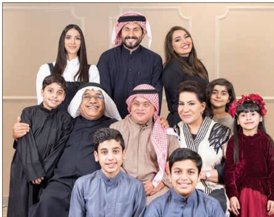
من إحدى قصص «كان في كل زمان»