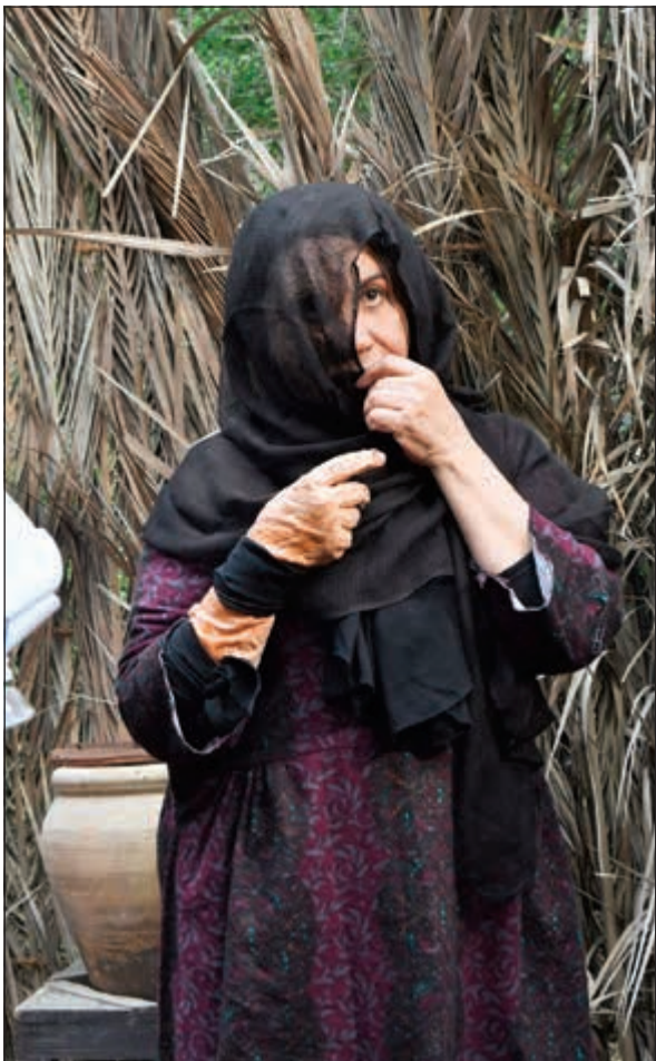
الفنانة القديرة سعاد عبدالله في إحدى شخصيات المسلسل