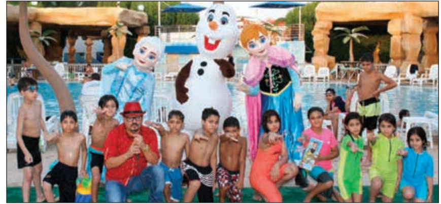
أحدى فقرات الاطفال

من خلال تواجد العديد من النجوم المجتمعي والفني وطرح مسابقات جديدة، مشيراً إلى أن الشركة عكفت على وضع خطة متكاملة للأنشطة الرمضانية لجذب