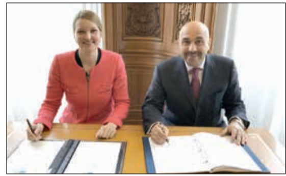
السفير سامي السليمان أثناء توقيع الاتفاقية

متعددة الأطراف التي تنظم عملية تبادل المعلومات لغايات ضريبية عن الحسابات المالية الخاصة بالمؤسسات المالية والمصرفية وكذلك الأفراد المقيمين في دول الأعضاء في المنتدى العالمي للشفافية. وأبدت الكثير من الدول رغبتها بتبادل تلك المعلومات الضريبية مع دولة الكويت علماً بأن دولة الكويت ستبدأ في التبادل التلقائي لتلك المعلومات الضريبية في شهر سبتمبر 2018 وفقاً للاتفاقية متعددة الأطراف للتبادل التلقائي لمعلومات الحسابات المالية التي تتضمن معيار الإبلاغ المشترك.