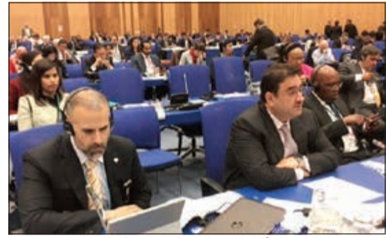
السفير صادق معرفي أثناء الاجتماعات التحضيرية

عالية المعاهدة. وناشد الدول الاربعة لمعاهدة عدم الانتشار الضغط على إسرائيل للانضمام والمصادقة عليها، لاسيما انها الطرف الوحيد خارج المعاهدة في منطقة الشرق الأوسط. واستعرض السفير معرفي مساهمات الكويت في جهود الدول العربية لتنفيذ قرار عام 1995 وإنشاء منطقة خالية من الأسلحة النووية وغيرها من أسلحة الدمار الشامل في الشرق الأوسط.