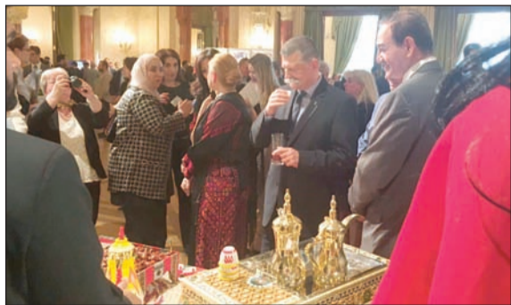
جانب من الحضور خلال فعاليات «الأيام الثقافية العربية»

وإجرائها في مجال القيم الإنسانية العالمية والفنون الجميلة ومختلف العلوم. وأضاف البيان ان جناح الكويت ضم العديد من المقتنيات واللوحات التراثية والأطعمة والحلوى الشعبية والملبوسات التراثية والمطبوعات القيمة ما يعبر عن موروثها الحضاري والثقافي.