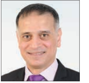
إعداد: د. طارق البكري