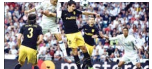
هدف.. وما شبع (أ.غ.ب)