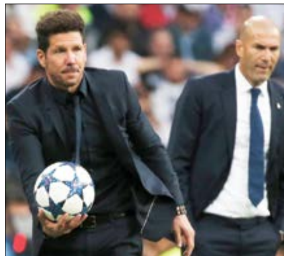
زين الدين زيدان ودييغو سيميوني

أنا بحاجة أيضا للتعبير عما في داخلي». سيميوني وأثق في المقابل، طالب مدرب أنتليكو لاعبيه بنسيان مباراة الذهاب، قائلا «يجب أن نضع هذه المباراة خلفنا». وأضاف «كرة القدم رائعة لأنك تشهد دائما أمورا غير متوقعة (...) ما زلت وأناظ بأن حظوظنا لاتزال قائمة. الفريق الخصم كان الأفضل خصوصا في إنهاء الهجمات ويجب تهنيئته». وشدد على «إننا سننتسب بحظوظنا حتى لو كانت ضئيلة». وأقر الأرجنتيني بأن «الأخطاء التي ارتكبتها لم تسمح لنا بالاندفاع إلى الأمام»، مضيفا «سجلوا هدفا، وبعد ذلك سنحت لنا فرصة حقيقية جدا عبر (الفرنسي كيفن غامبرو تصدى لها الحارس بطريقة جيدة». وتابع: «في الشوط الثاني لم نستغل كثيرا العمق، وحصلنا على فرص قليلة في حين أنهم كانوا خطيرين في المساحات واضرونا جدا».