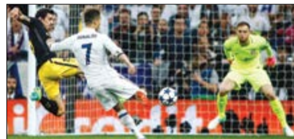
الثاني.. وبني بعد (أ.غ.ب)