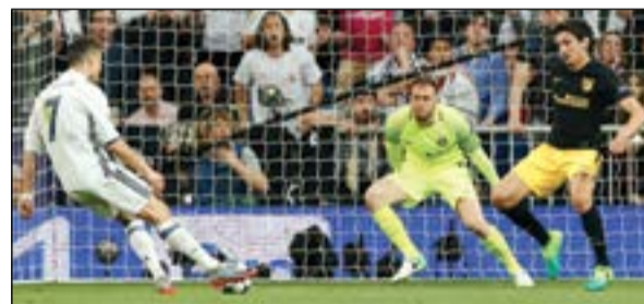
الثالث.. أخيرا ارتاح

وكرس ريال مدريد حامل الرقم القياسي في البطولة برصيد 11 لقباً عقده القارية لأنتليكو، إذ تواجهها 4 مرات، بينها ثلاث