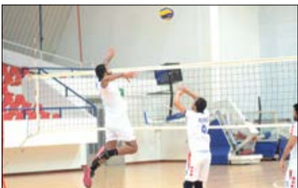
لاعب الكويت قدموا مستوى لافتا هذا الموسم