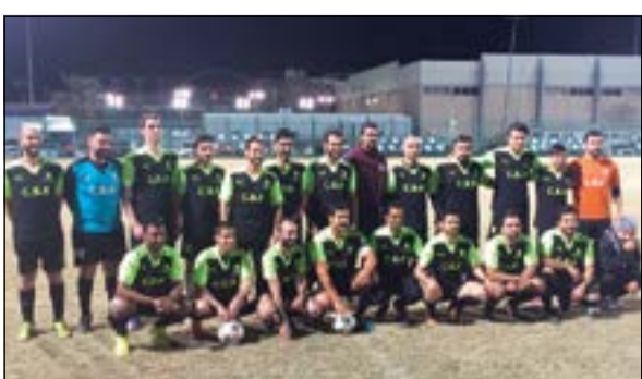
فريق البنك التجاري يتأهل للنهائي لأول مرة