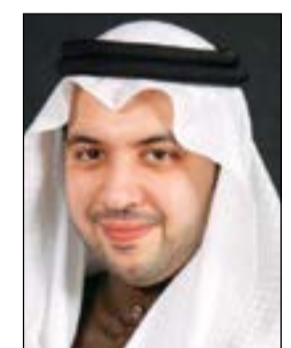
الشيخ مبارك الصباح

بان هذه التوصية تخضع لموافقة الجمعية العمومية لمساهمي الشركة والجهات الرقابية المختصة. وفي هذا السياق، قال رئيس مجلس إدارة شركة القرين لصناعة الكيماويات البترولية الشيخ