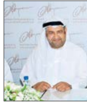
جانب من عمومية «أبيار» أمس

كريست الذي تم الانتهاء من المخططات الهندسية له، فيما يجري حالياً استكمال إصدار التراخيص المطلوبة من الجهات المعتمدة في إمارة دبي، وتم البدء في إجراءات المناقصة الخاصة بالمشروع للحصول على أفضل الأسعار والعروض الفنية على أن تبدأ في عملية التشييد خلال عام 2017.