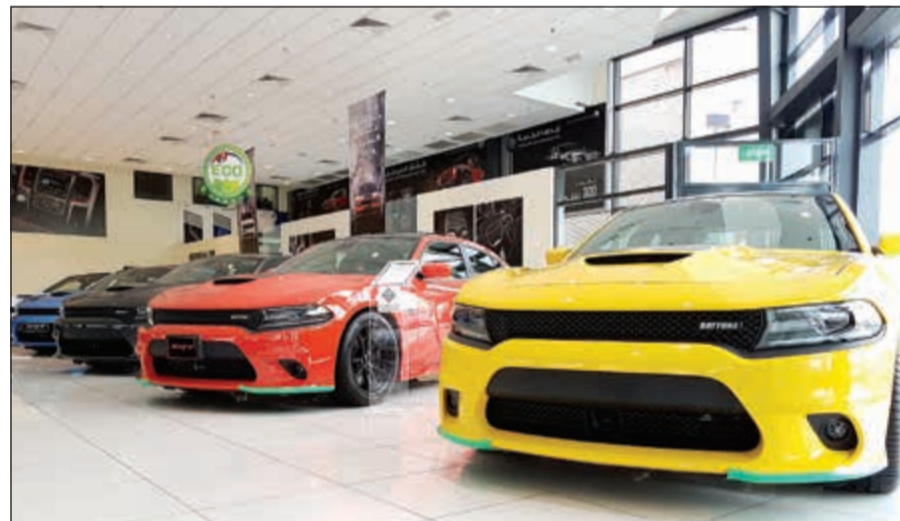
دوج تشارجر SRT

وتشمل المركبة، التي تعتبر في الوقت الحالي أسرع مركبة جيب على الإطلاق، على محرك V8 سعة 6,4 ليترات مع تكنولوجيا توفير الوقود، والذي يحقق قوة حصانية تبلغ 475 حصاناً وعزم دوران يبلغ 470 رطلاً - قدماً. ويشتمل الأداء على معدل تسارع من صفر إلى 100 كلم/ساعة في 4,8 ثوان، ومن صفر إلى 161 ثم صفر في 16,3 ثانية وربع الميل في مدى متوسط يبلغ 13 ثانية. وأقصى سرعة 257 كلم/ساعة. ويأتي غراندي شيروكي SRT بمظهر رياضي حازم وجذاب، وتشتمل على مجموعة من التجهيزات المرغوبة التي تليق بشارة SRT.