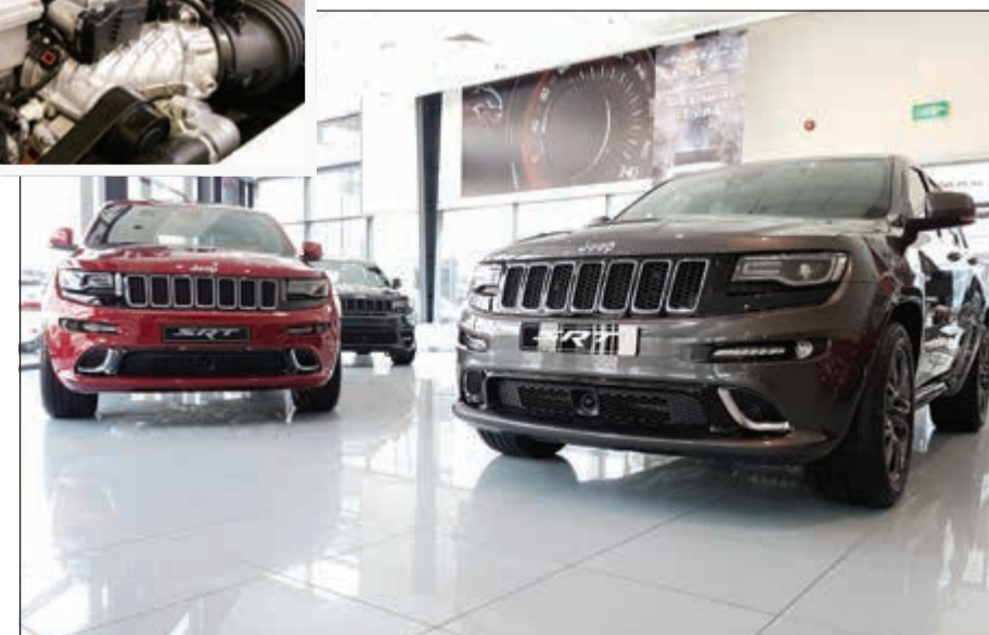
غراندي شيروكي SRT

من خلال تحسين شفط وعادم المحرك مع نظام موبار لامتصاص الهواء البارد ثلاث وضعيات لنظام التحكم الإلكتروني في الثبات ESC مع إطارات كودبير إنغل Goodyear Eagle F1 عالية الأداء. كرايسلر 300 SRT ويعتبر المحرك بمنزلة القلب النابض لأي سيارة ذات أداء قوي. وتبلغ قوة محرك HEMI V8 المجهزة به سيارة