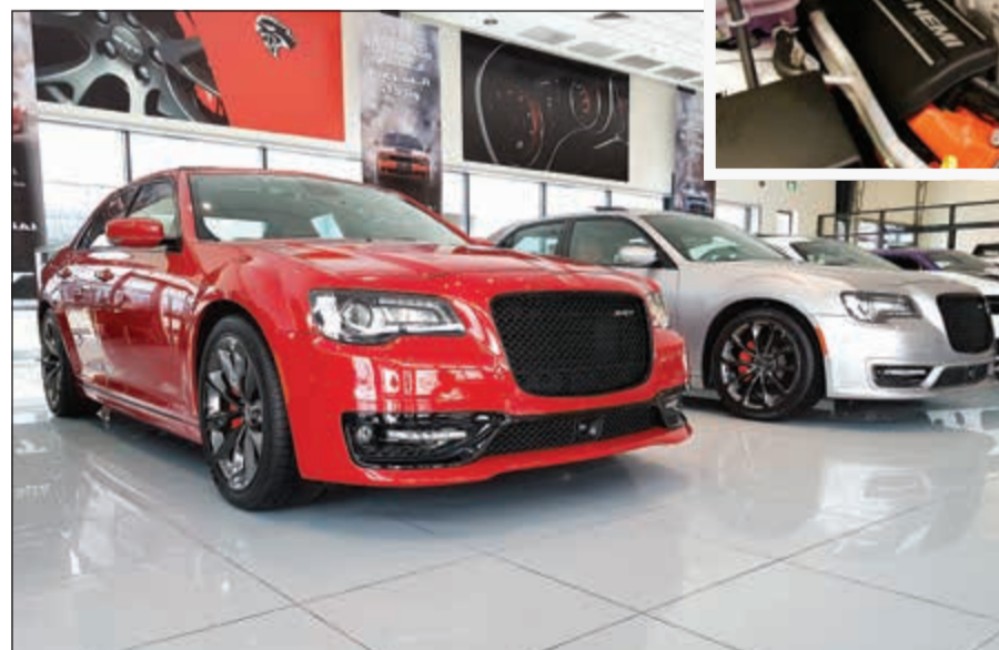
كرايسلر 300 SRT