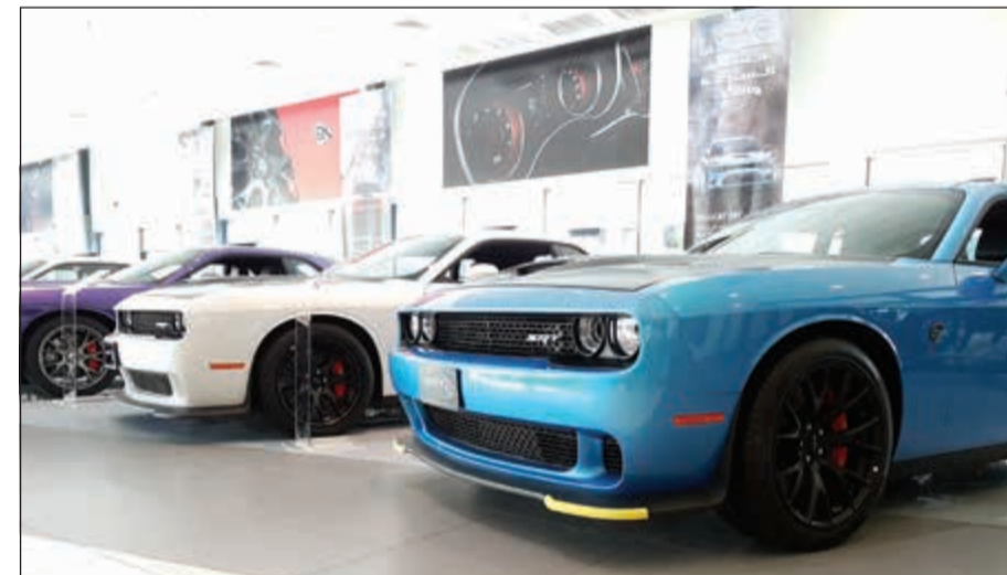
دوج تشالنجر SRT