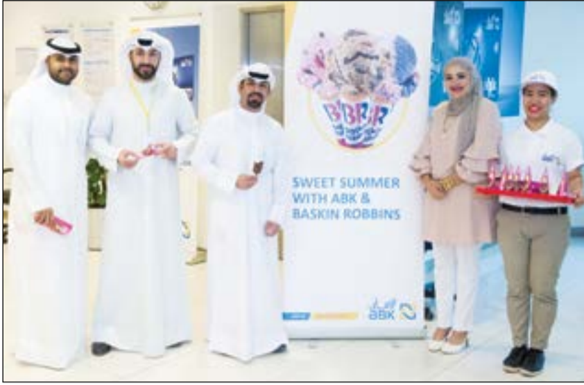
موظفو وعملاء البنك الأهلي أثناء حملة الصيف الترويجية بالتعاون مع باسكن روبنز

أقام البنك الأهلي الكويتي حملة الصيف الترويجية بالتعاون مع باسكن روبنز للسنة الثالثة على التوالي وذلك بمناسبة بداية موسم الصيف، حيث بدأت الحملة في المقر الرئيسي للبنك يوم الأحد الموافق 23 أبريل الماضي، وقد قام موظفو باسكن روبنز بتقديم أطيب أنواع الآيس كريم مجاناً لكافة عملاء وموظفي البنك للاستمتاع بالتحفكات اللذيذة المتميزة.