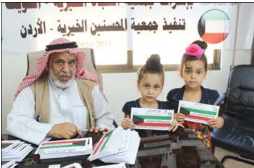
تقديم المساعدات للأيام

أعلنت لجنة زكاة كيفان التابعة لجمعية النجاة الخيرية عن كفالته لـ 1053 يتيماً داخل الكويت وخارجها والغلبة للأيام السوريين الذين يعيشون في دول اللجوء، وذلك خلال مشروع «حنين لكفالة اليتيم» وتبلغ قيمة اليتيم الواحد تبلغ 15 ديناراً شهرياً خارج الكويت و20 ديناراً شهرياً داخل الكويت.