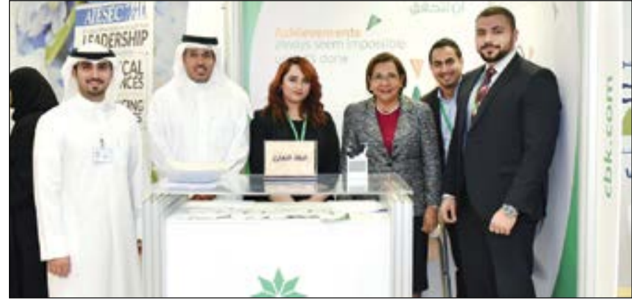
د.موضي الحمود لدى زيارتها جناح البنك التجاري في المعرض

شارك البنك التجاري في المعرض الوظيفي السنوي والذي تنظمه الجامعة العربية المفتوحة بحضور رئيس الجامعة العربية المفتوحة د.موضي الحمود ومدير الجامعة العربية المفتوحة بالكويت د.نايف المطيري، وعدد كبير من المسؤولين والأكاديميين بالجامعة.