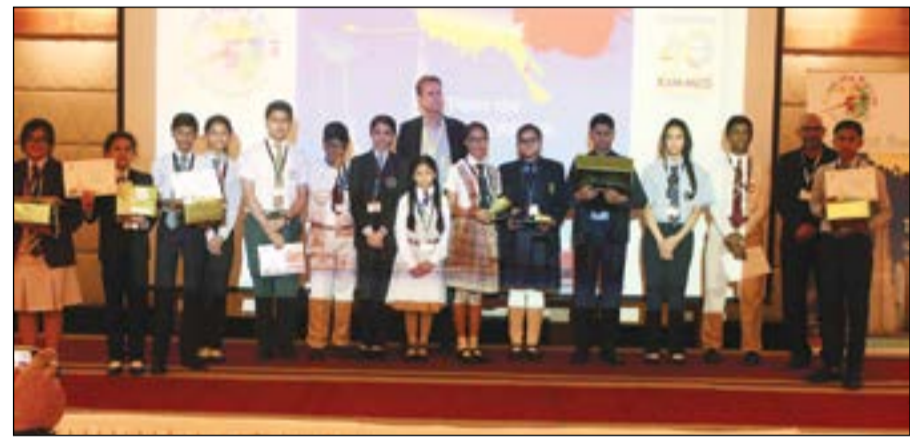
الطلبة الفائزون مع مارك ويسترامير

عقدت شركة الكويت لصناعة المواد العازلة «كيمكو»، المزود الرئيسي لحلول العزل في الكويت، وهي إحدى شركات صناعات الغانم، مسابقة رسم بعنوان «حدد مستقبل العالم الذي تراه»، مع طلبة المدارس في الكويت، وقد حضر الفعالية التي عقدت في هوليداي إن في السالمية أكثر من 100 طالب من 15 مدرسة مختلفة، للمشاركة في هذه المسابقة التي أتت كجزء من احتفال «كيمكو» بمرور 40 سنة على تأسيسها.