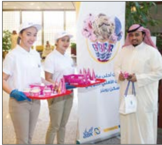
تقديم الآيس كريم للعملاء والموظفين