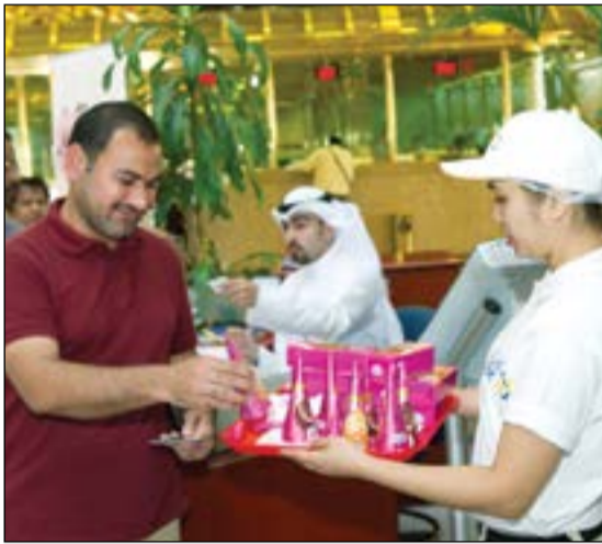
جانب من الحملة الترويجية

وقد غطت هذه الحملة جميع فروع البنك الأهلي الكويتي المنتشرة في كافة مناطق الكويت.