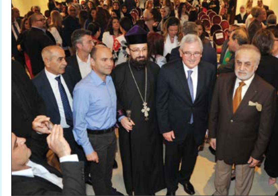
الوزير جان أوغاسبيان وحسان حوجو وعدد من الحضور

المراة من تصويرها واستغلالها من أجل التسويق الإعلاني. وأوضح أنه أطلع خلال لقاءه مع الأمين العام للمجلس الأعلى للتخطيط د. خالد المهدي على المشروع الذي تنفذه الكويت مع البرنامج الإنمائي للأمم المتحدة وجامعة الكويت حول تمكين المرأة ودور المرأة في الاقتصاد الوطني، متمنياً أن يكون هناك مشروع مشترك لخدمة المجتمع المدني في البلدين. وعن توقيع الاتفاقية أوضح أن المناقشة هي المسودة الاتفاقية لكل دولة وجهة نظر ورؤية تضعها وفيما بعد تتحول عبر الطرق الدبلوماسية المعتمدة إلى اتفاقية ترفعها وزيرة خارجية لبنان إلى خارجية الكويت ويتم تحديد أطر التوقيع بالطرق الدبلوماسية المتبعة بين الدول.