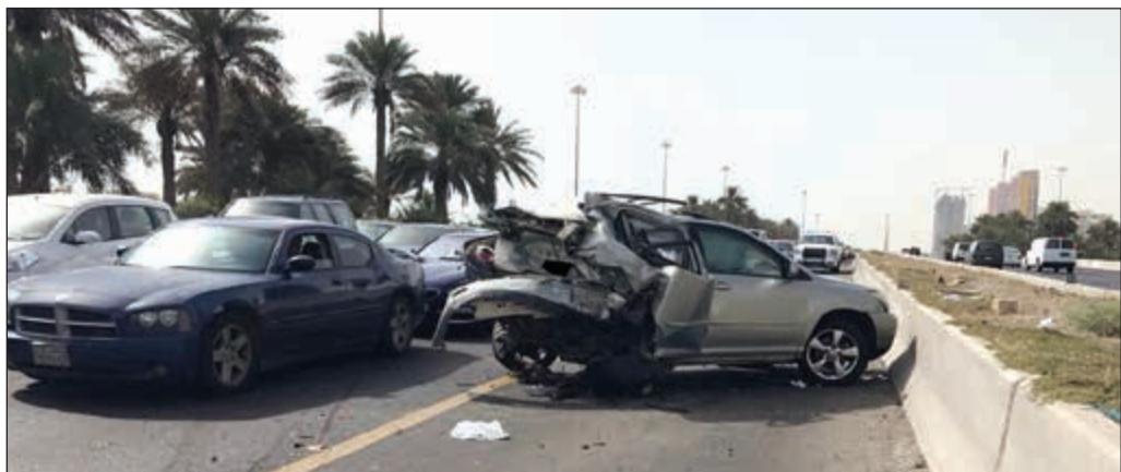
المركبات عقب الحادث