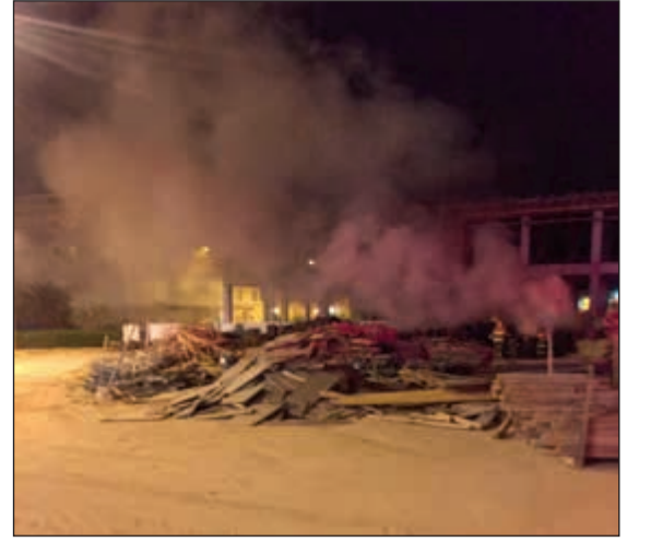
جانب من الحريق في كومة الأخشاب