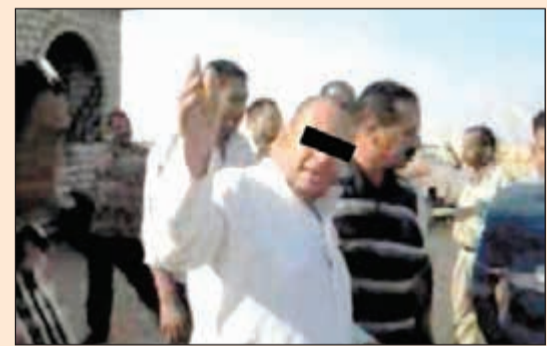
المتهم يقوم بمتمثيل الجريمة

لديه من الأدلة الكافية ما يدين الجاني ومن اشترك معه بالجريمة وما يحض لنا بال البرؤية الجاني معلقا على حبل المشنقة..