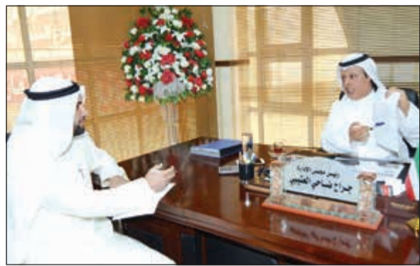
جانب من المؤتمر الصحافي لجمعية الفردوس التعاونية