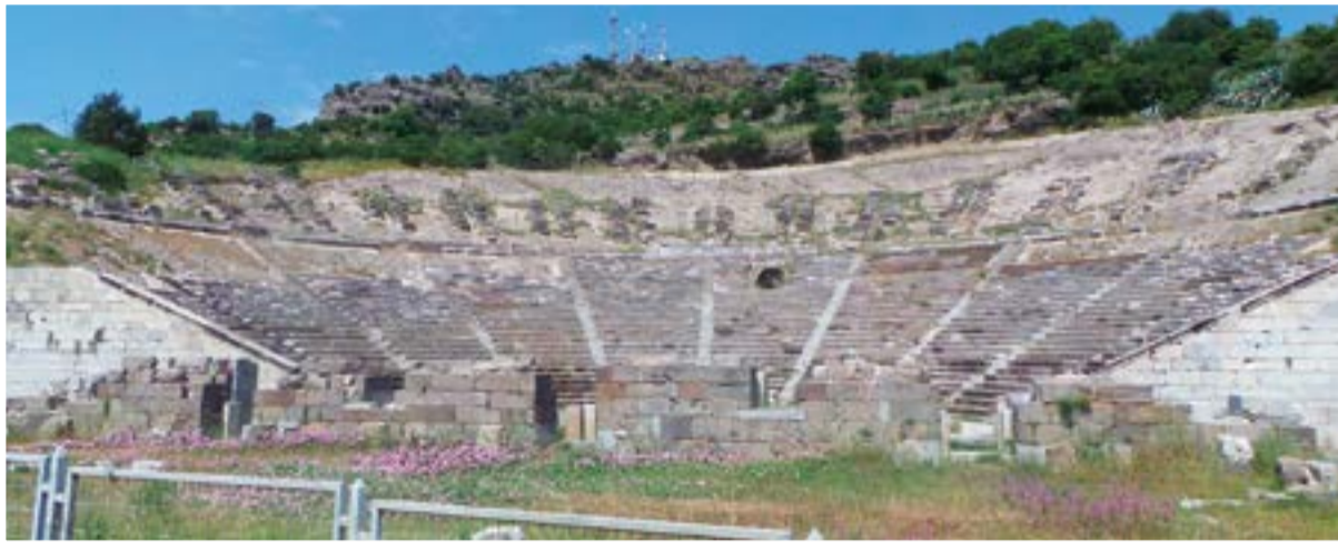
المرح الروماني القديم في مدينة بودروم

تتميز فنادق «سويس أوتيل» في تركيا بإطلالات خلابة فريدة من نوعها على بحر إيجة والبوسفور ومرمرية وغيرها، تمنحك تجربة إقامة ملكية، وتعد من أهم المعالم في تركيا، كما تتميز بقربها من المناطق الحيوية مثل مراكز التسوق والأماكن الترفيهية والمطاعم. كانت محطتنا الأولى من الرحلة في فندق «سويس أوتيل» أزميز الواقع في قلب المدينة والذي يتميز بحديقة غناء تمتد على مساحة 40000 قدم مربعة وإطلالة رائعة على بحر إيجة، وعلى مقربة من المركز التجاري ومنتهز أزميز الثقافي ومدنية أفسوس التاريخية العريقة، يضم الفندق آلاف الغرف الفندقية بمزيد من الساليب الخصوصية والراحة وبه طوابق مخصصة لذوي الاحتياجات الخاصة وأخرى للمدخنين، كما يلبي جميع احتياجات رجال الأعمال، والنخبة في اجنحة خاصة، ويوفر قاعة من الألبان الشهية من مختلف القارات يحضرها الطهاة أمام الضيوف مباشرة، ويضم الفندق العديد من القطع الفنية والتماثيل لأشهر الفنانين والنحاتين العالميين والأترانك، ويحتوي على منتج صحي وحمامات للسباحة والسونا والبهار والجاكوزي. وفي المرحلة الثانية من الزيارة حط رحال الوفد في رحاب «سويس أوتيل» الذي يحتضن شاطئ بحر إيجة ويقع على بعد 22 كم من مركز مدينة بودروم، ويعد نموذجا للرفاهية الفندقية حيث يضم 66 غرفة فندقية، والعديد من الأجنحة والشقق