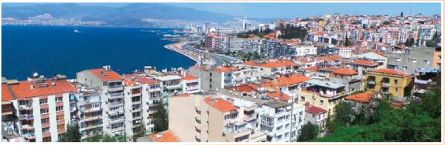
أزمير.. سحر المكان وجمال الطبيعة