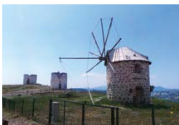
طواحين الهواء من أعلى بودروم