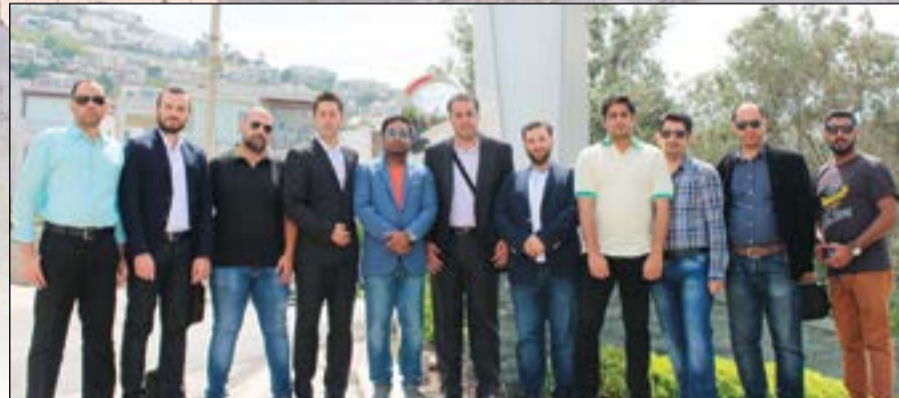
أعضاء الوفد مع إدارة فندق «سويس اوتيل» وبودروم والممثل الاقليمي للمبيعات في «التركية»

وبلاد المصانع بدون مداخن! «الأنباء» تلقت دعوة من الخطوط الجوية التركية وشركة فنادق أكور، وبرفقة عدد من ممثلي شركات السياحة والسفر الكويتية لزيارة بعض المدن التركية وهي: إزمير وبودروم واسطنبول لتعريف المواطنين والمقيمين بأهم الأماكن والفرص السياحية المتاحة بتلك المناطق. ما شاهدناه خلال جولتنا التي استغرقت 7 أيام من الصعب وصفه، وإن قدر لنا ذلك فإنه يحتاج إلى مجلدات.. ففي أرض الاحلام وموطن الاساطير، وداخل بوتقة انصهار الحضارات، المشهد مختلف كليا، فتركيا ليست كسواها، حيث الجمال سيد الموقف.. ثمة مناظر طبيعة وكنوز أثرية، ومنشآت عصرية، ونهضة متكاملة، تأسر الابواب وتسرع الناظرين، تخامر الخواطر والوجدان، وتهفو إليها الأذن على الدوام.