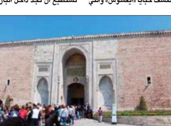
ازدحام الزوار امام بوابة قصر الباب العالي

حينما تتجول في السوق القديم أو «بازار إزمير»، تجذبك المتاجر العتيقة التي تستلهم الحضارة العثمانية في أشكالها وقبائها العلوية والوانها المميزة، تستطيع ان تجد داخل البازار