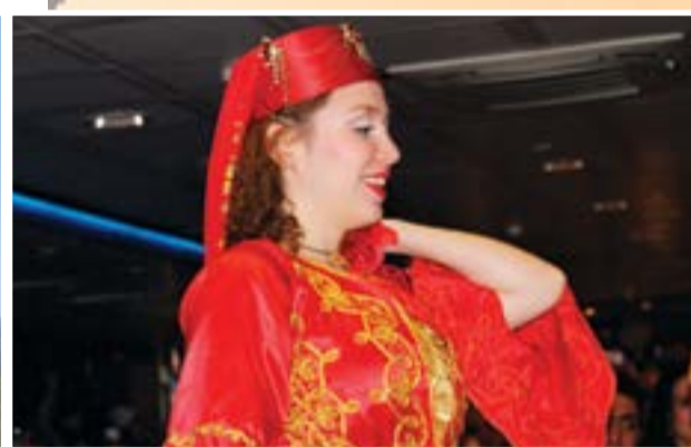
رقصات فنية جميلة في رحاب البوسفور