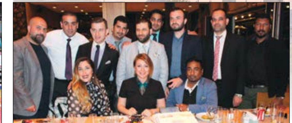
..ومع إدارة «سويس أوتيل» البوسفور خلال حفل عشاء على شرف الوفد