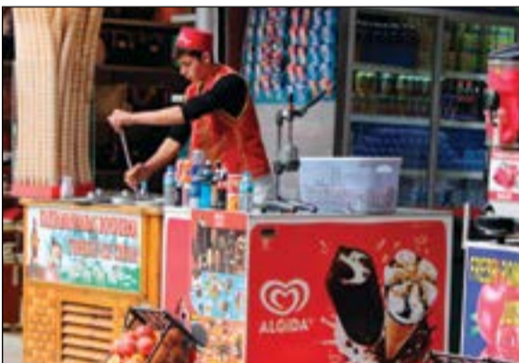
اليس كريم التركي اللذيذ