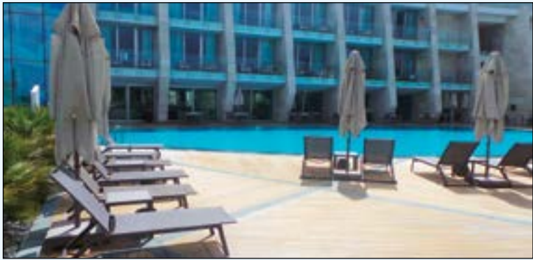
حمامات سباحة عصرية