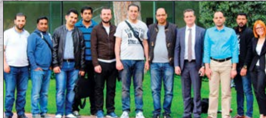
أعضاء وفد الرحلة في صورة جماعية مع إدارة فندق «سويس اوتيل»، إزمير والممثل الاقليمي للمبيعات في الخطوط الجوية التركية

تركيا، حيث تعود الى القرن الـ 13 قبل الميلاد وكانت تعرف بـ«هاليكارناسوس»، وتحتوي على آثار عديدة موهلة في القدم، وتشتهر بكونها مسقط رأس أبو التاريخ «هيرودوت».