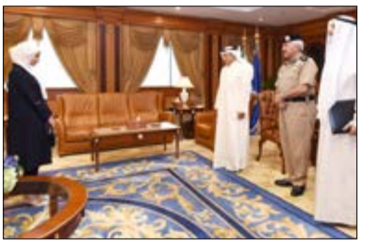
الشيخ خالد الجراح والفريق محمود الدوسري واللواء د.فهد الدوسري خلال أداء المحققة ضحي العازمي القسم

استقبل نائب رئيس مجلس الوزراء ووزير الداخلية الشيخ خالد الجراح امس بحضور وكيل وزارة الداخلية الفريق محمود الدوسري، ومدير عام الإدارة العامة للتحقيقات اللواء حقوقي د.فهد إبراهيم الدوسري المحقق «ج» ضحي عبيد العازمي، وذلك بمناسبة صدور قرار تعيينها بالإدارة العامة للتحقيقات طبقاً للمادة «الخامسة» من قانون التحقيقات.