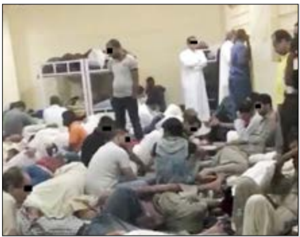
جانب من المقطع المصور الذي تم تداوله على وسائل التواصل لارتداد نظارة المرور

السي رجال مباحث شؤون الإقامة عن شخص يعرض عبر وسائل التواصل الاجتماعي لاستعداده لاستخراج فيزا دخول، ليتم تكثيف التحريات وضبطه. إلى ذلك، ذكرت الإدارة العامة للعلاقات والإعلام الأمني أن الإدارة العامة لمباحث شؤون الإقامة تمكنت من القبض على وأحد عربي بتهمة استخراج تأشيرات مخالف للقانون. وفي التفاصيل، وردت معلومة من أحد مصادر الإدارة تفيد بقيام أحد الوافدين من جنسية عربية باستخراج تأشيرات للوافدين للحصول على سمة دخول إلى البلاد