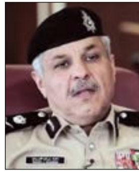
اللواء الشيخ مازن الجراح

السي رجال مباحث شؤون الإقامة عن شخص يعرض عبر وسائل التواصل الاجتماعي لاستعداده لاستخراج فيزا دخول، ليتم تكثيف التحريات وضبطه. إلى ذلك، ذكرت الإدارة العامة للعلاقات والإعلام الأمني أن الإدارة العامة لمباحث شؤون الإقامة تمكنت من القبض على وأحد عربي بتهمة استخراج تأشيرات مخالف للقانون. وفي التفاصيل، وردت معلومة من أحد مصادر الإدارة تفيد بقيام أحد الوافدين من جنسية عربية باستخراج تأشيرات للوافدين للحصول على سمة دخول إلى البلاد