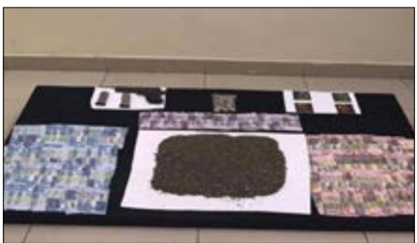
المضبوطات من المواد المخدرة بعضها كان معداً للبيع