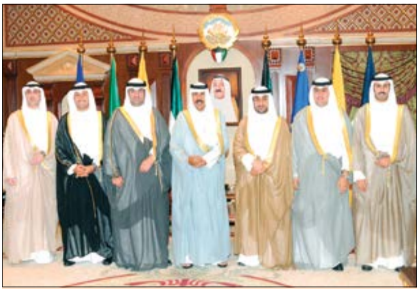
سمو ولي العهد الشيخ نواف الاحمد مستقيلا خالد الرضوان ورئيس وأعضاء مجلس ادارة المشروعات الصغيرة والمتوسطة