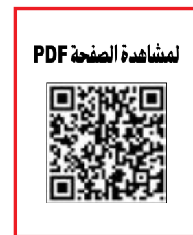
لمشاهدة الصفحة PDF

السلطان: الكويت بحاجة ملحة لإنشاء اللجنة الوطنية للعلوم والتكنولوجيا والابتكار لدفع البلاد نحو التقدم والأزدهار