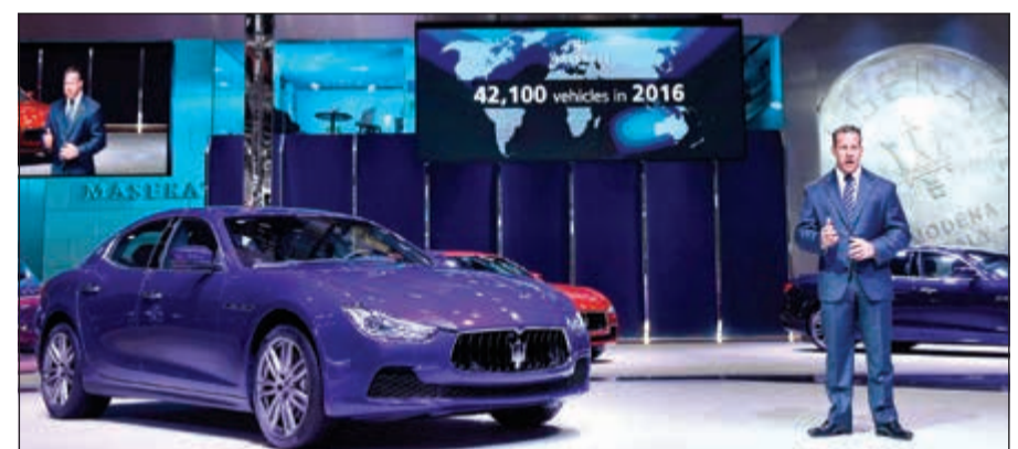
جناح مازيراتي في معرض شنغهاي الدولي للسيارات