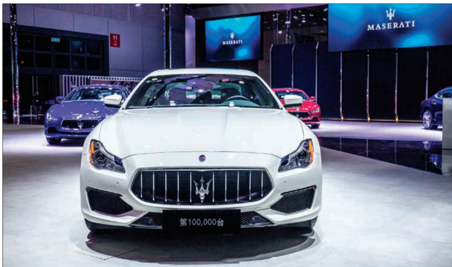
السيارة رقم 100 ألف