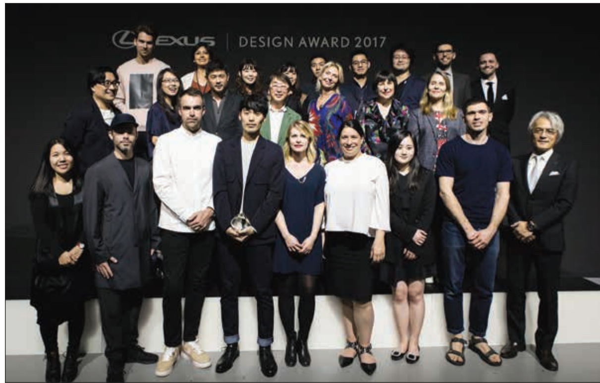
المشاركون في تصفيات مسابقة لكزس مع فريق التحكيم

عندما تقتصر العراقة بالحداثة: تم تصميم هذا المعرض الخاص بالمساحات المفتوحة من وحي فلسفة «الاقتران»، ويهدف إلى ابتكار تجربة مجسم يرتكز على الأرض ولكنه معلق في نفس الوقت بموجة من الضوء والجسيمات. وباستخدام مزيج من المواد القديمة التي تقتصر بتكنولوجيا حديثة، إذ تقدم مجموعة «ذا ميديات ماتر» طباعة الزجاج ثلاثية الأبعاد على مستوى هندسة العمارة.