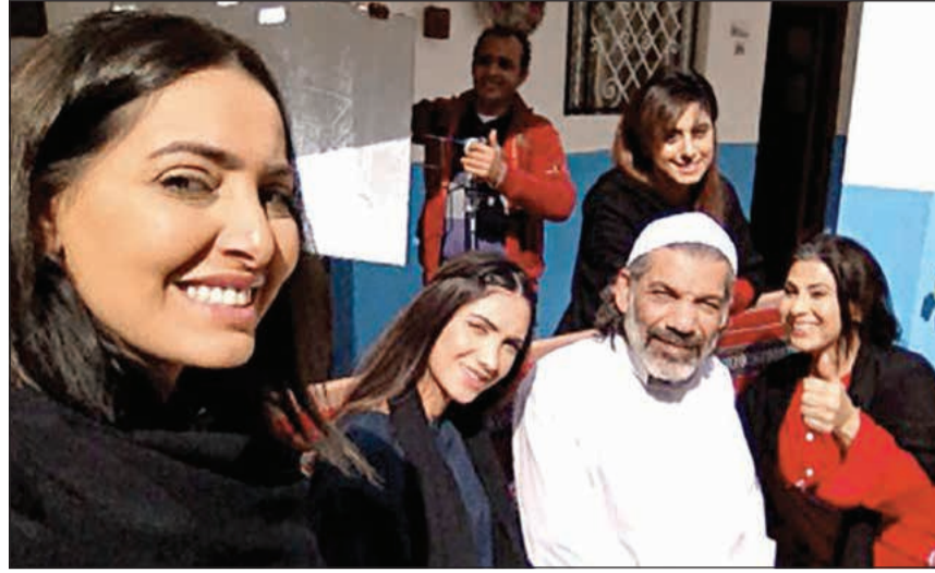
من سداسية «الحوش»