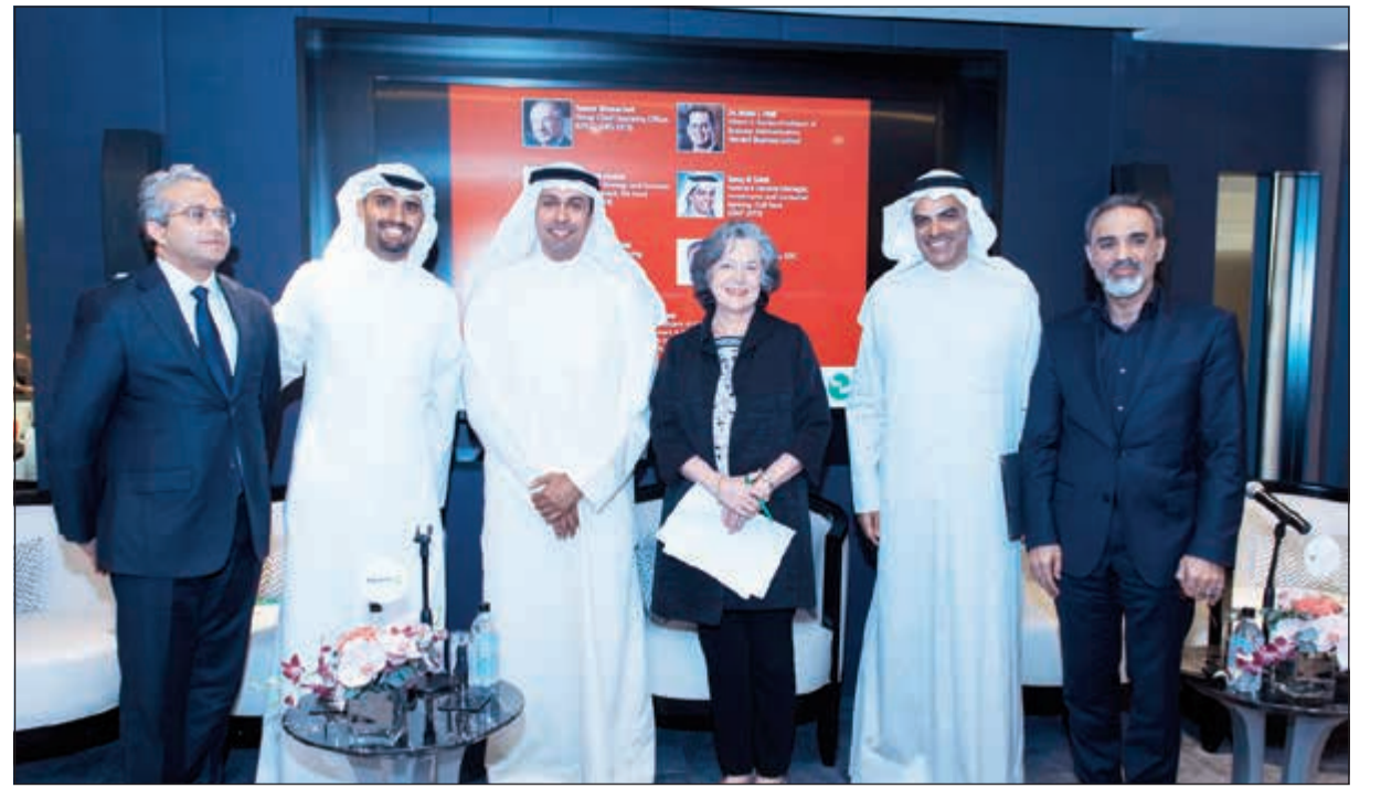
المتحدثون في الندوة