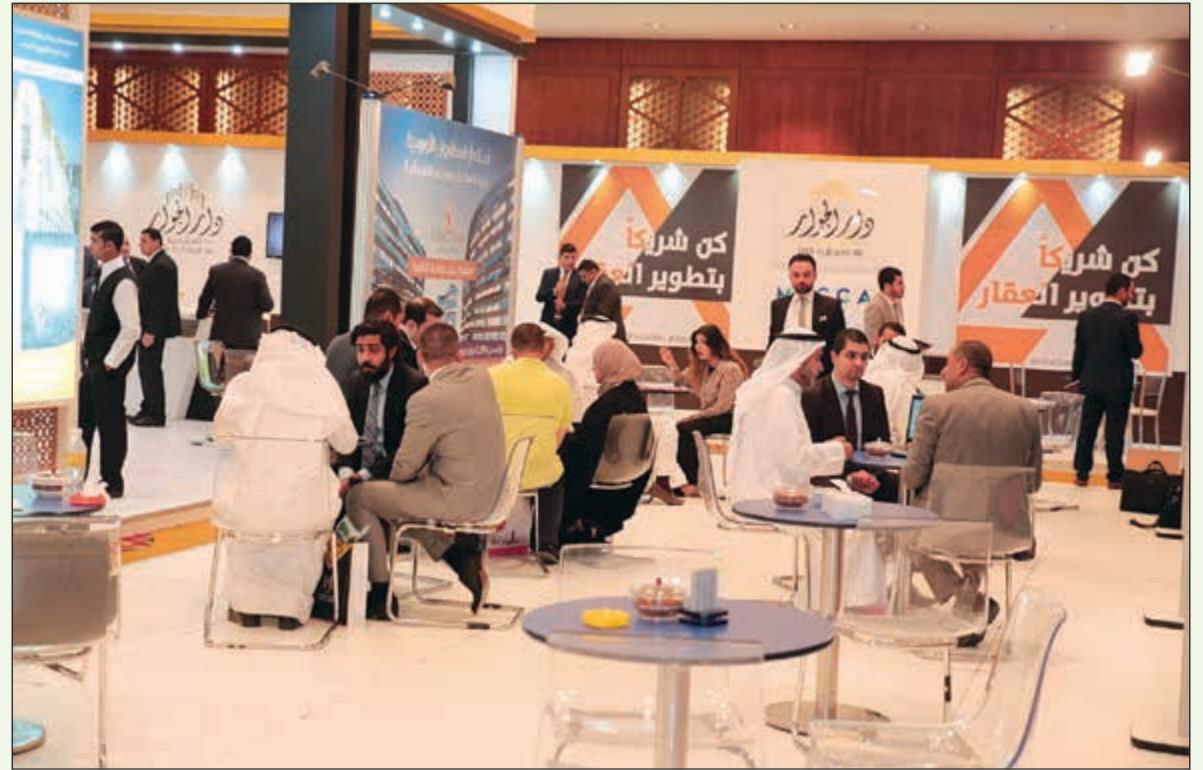
إقبال جماهيري على معارض النخبة

التجاري والصناعي ومظاهر الحضارة. وما لا شك فيه أن جغرافيا بين مدن إسطنبول وأنقرة وأزمير، وجمعها لكل المميزات الموجودة بالمدن الأخرى مجتمعية. واعتقد أن ذلك هو سبب توجه أنظار جميع المهتمين بالاستثمار العقاري أو الباحثين عن حياة أفضل لمدينة بورصة الخضراء تحديداً.