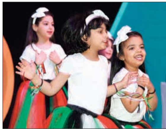
عرض روضة السرة