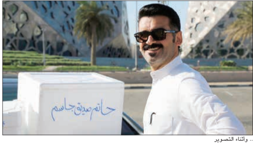
... وأثناء التصوير

استطرد إيراج: قصة الفيلم بسيطة، الهدف منها التأكيد على عمق ومتانة العلاقات الكويتية المصرية الممتدة لسنوات، وكوّن أهدت على عاتقي أن يحمل الفيلم عبارة «شكرا الى البلد الذي احتضني اربع سنوات هي مدة دراستي الجامعية»