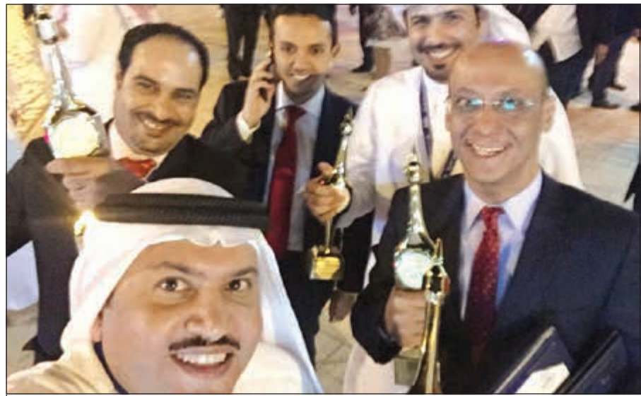
لقطة لوفد التلفزيون مع جوائزهم