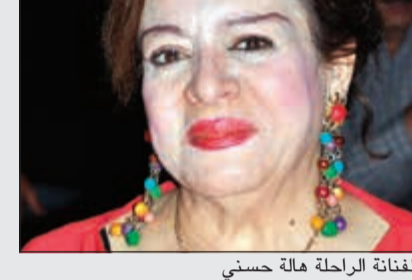
الفنانة الراحلة هالة حسني