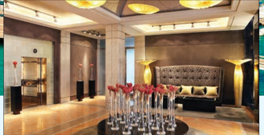
فخامة وعراقة في فندق آرئس برشلونة