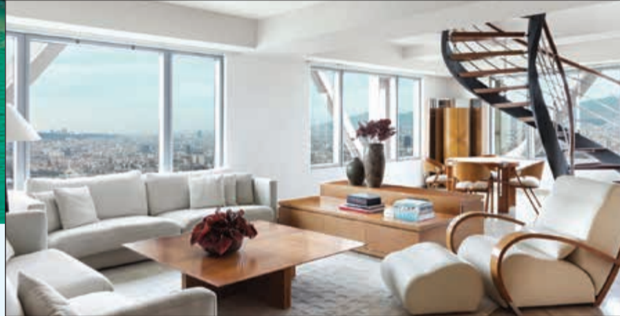
تصميم عصري يناسب الأنواق الشبابية