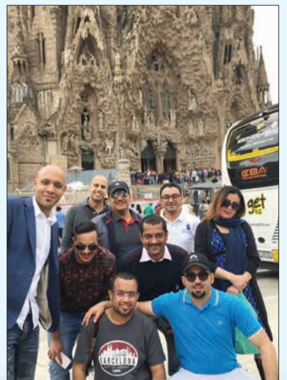
الوفد امام احد المعالم الأثرية