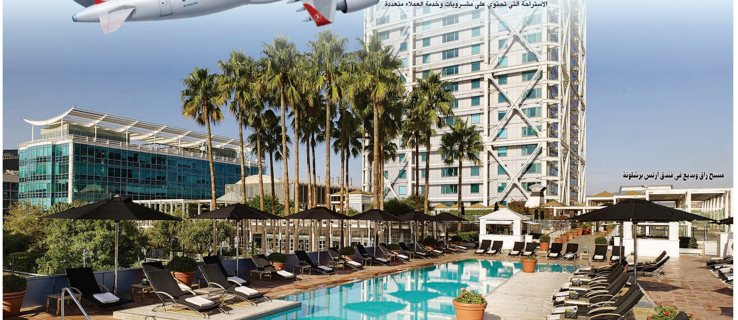
مسيح راق وبيدع في فندق آرئس برشلونة